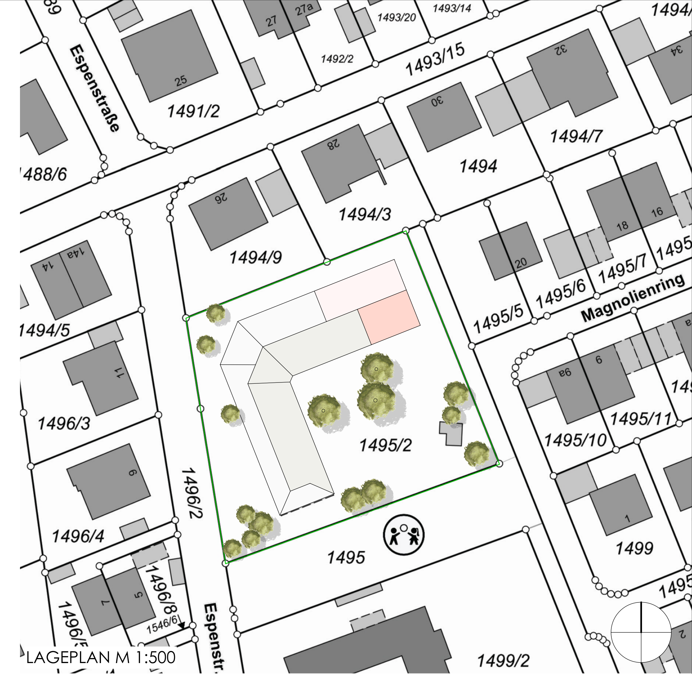
LAGEPLAN M 1:500