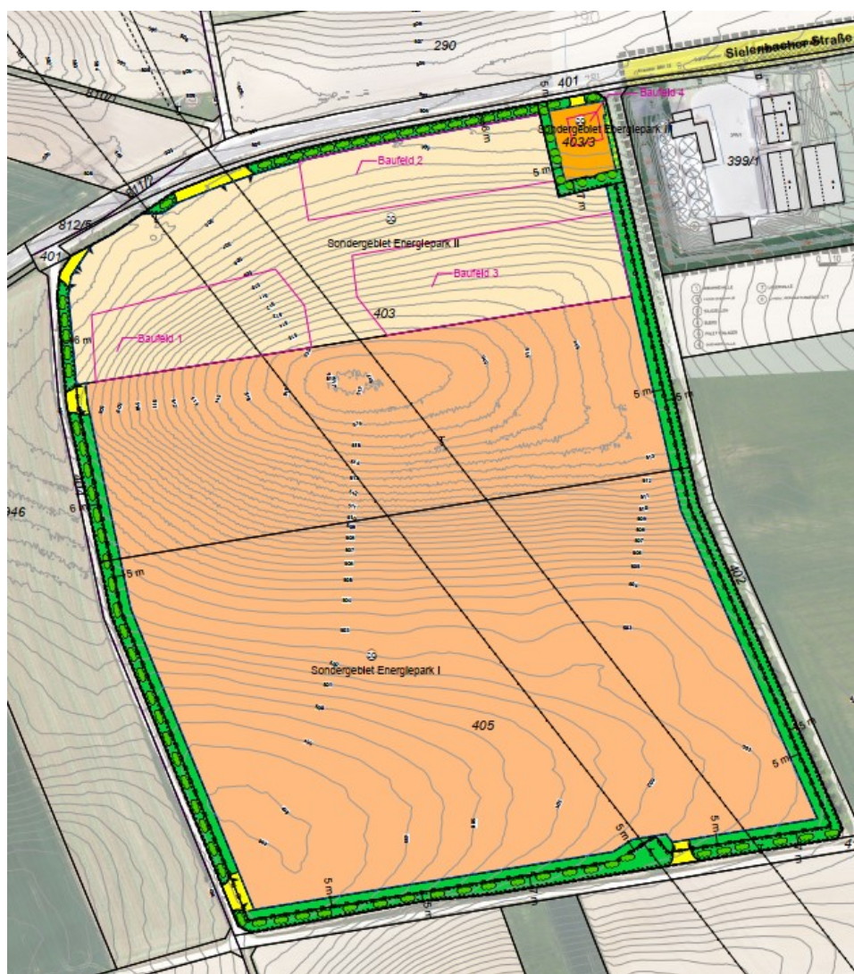
Ausschnitt aus dem aktuellen Antragsentwurf

In der Sitzung des Bauausschusses am 11.03.2025 wurde der Entwurf nichtöffentlich vorgestellt. Dabei wurde beschlossen, dass die vorgestellten Unterlagen als Basis für die weitere Planung betrachtet werden können und dem Gemeinderat wird empfohlen auf einen Vorhabenbezogenen Bebauungsplan zu verzichten.