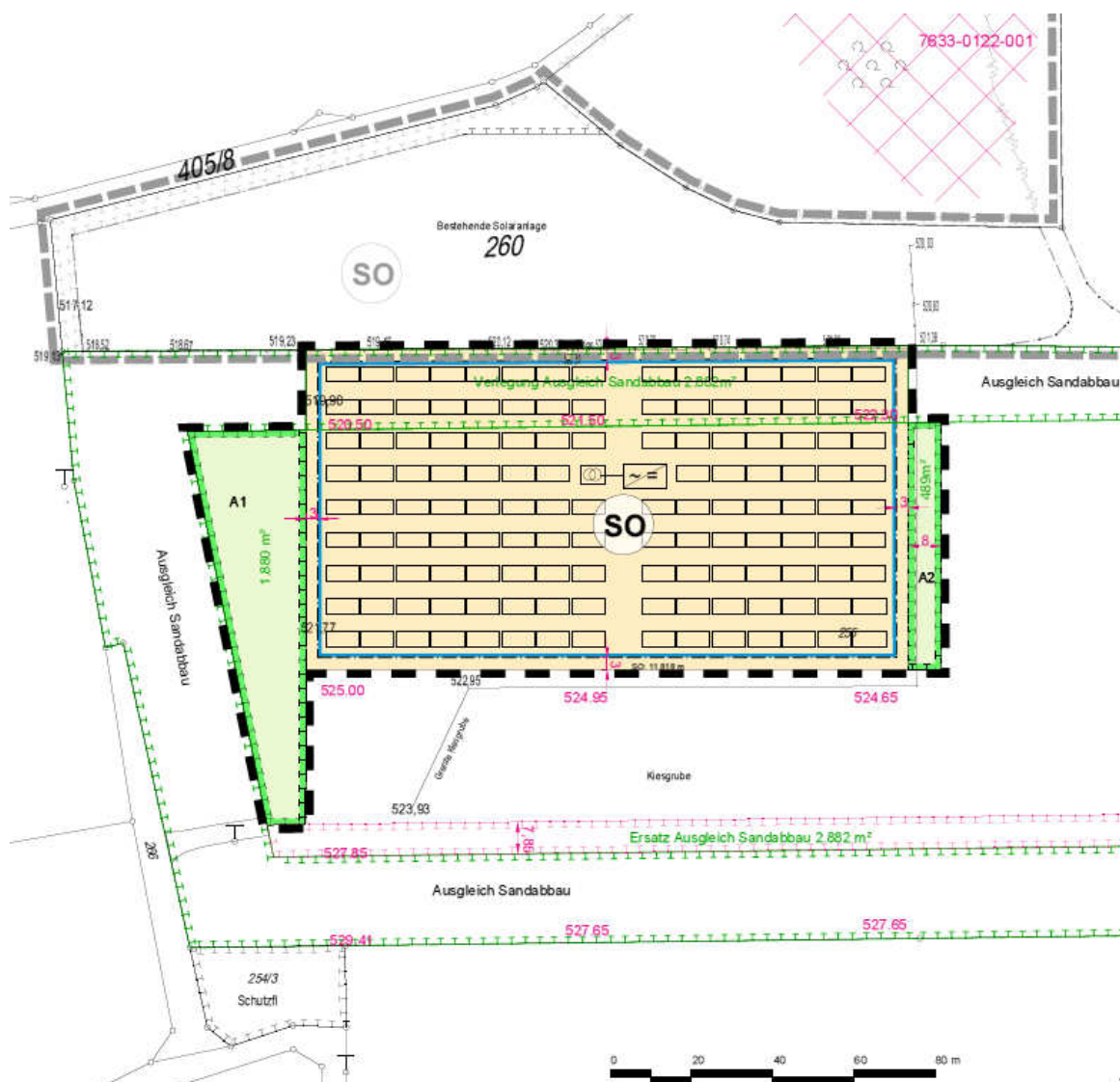
Detail des Änderungsbereichs