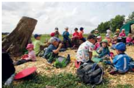
Die Brotzeit im Waldkindergarten schmeckt lecker