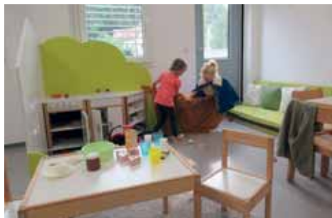
Bei den Erlbachtrollen gibt es viel zu entdecken