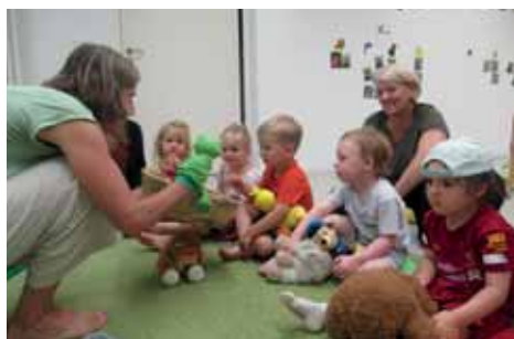
Der Kindergartenfrosch von St. Irmengard begrüßt uns