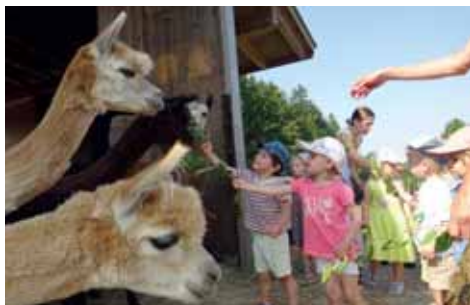
Bei den Alpakas

auf der Alpakawiese stärkten sich unsere kleinen Wanderer. Zum Abschluss durften wir mit dem Hortbus nachhause in die Flohkiste fahren. Vielen Dank an unser „Hort-Taxi“!