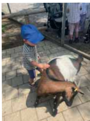
Text und Fotos: Kinderhaus Erlbachtrolle