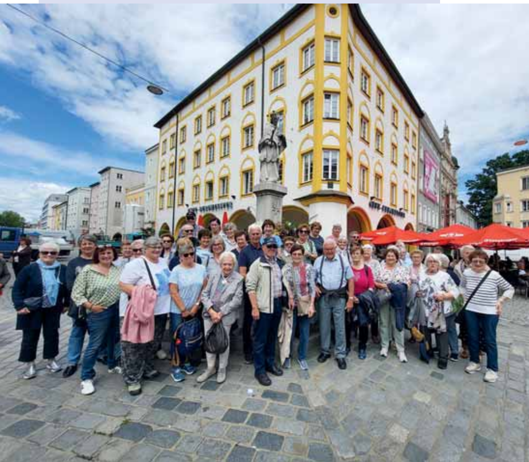
Ffoto: Ausflug nach Rosenheim

Dieser Ausflug wird in ähnlicher Form 2025 wiederholt. Weitere Infos folgen.