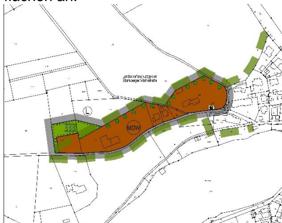
13. Änderung des FNP

Im derzeit rechtswirksamen Flächennutzungsplan der Stadt Ebersberg von 2014 ist der räumliche Geltungsbereich der 13. Änderung weitgehend als Mischgebiet dargestellt. Ein kleiner Teilbereich im Westen, der innerhalb des Landschaftsschutzgebietes „Ebersberger Weiherkette“ liegt, ist als Fläche für die Landwirtschaft dargestellt. Nördlich und südwestlich schließen Flächen für die Landwirtschaft an, südlich eine Grünfläche sowie südöstlich ein Mischgebiet. Diese Flächen sind ebenfalls innerhalb des Landschaftsschutzgebietes gelegen. Östlich grenzt das Plangebiet an Wohnbauflächen an.