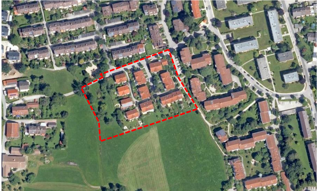
Abb. 1 Plangebiet, ohne Maßstab, Quelle: © Bayerische Vermessungsverwaltung (2022)

Das Plangebiet befindet sich im Südwesten des Stadtgebiets Ebersberg an der Einmündungen der Großvenedigerstraße in die Wettersteinstraße und umfasst die Grundstücke mit folgenden Flurnummern: 1794/1, 1794/2, 1794/3, 1794/4, 1794/5, 1794/6, 1794/7, 1794/8, 1794/9, 1794/10, 1794/11, 1794/12, 1794/13, 1794/14, 1794/15, 1794/16, 1794/17, 1794/18, 1794/19, 1794/20, 1794/21, 1794/22, 1794/23, 1794/24, 1794/25, 1794/26, 1794/27, 1794/29, 1794/30, 1794/31.