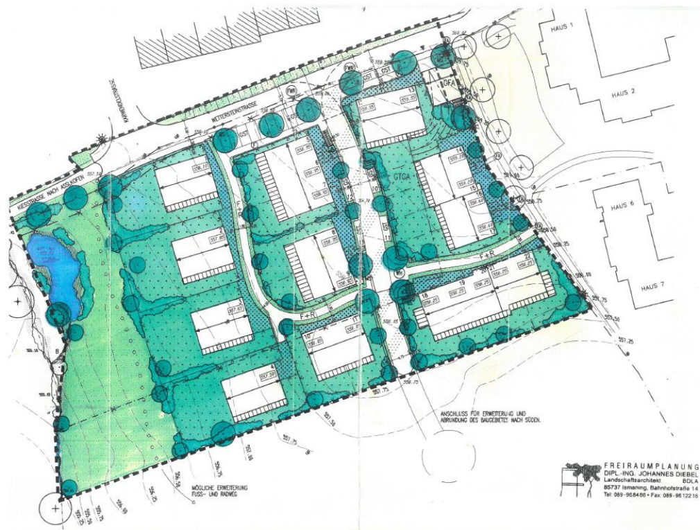
Abb. 4 Planzeichnung des Grünordnungsplans, ohne Maßstab