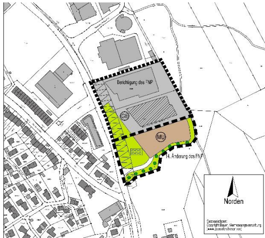
Berichtigung FNP / 14. Änderung des FNP