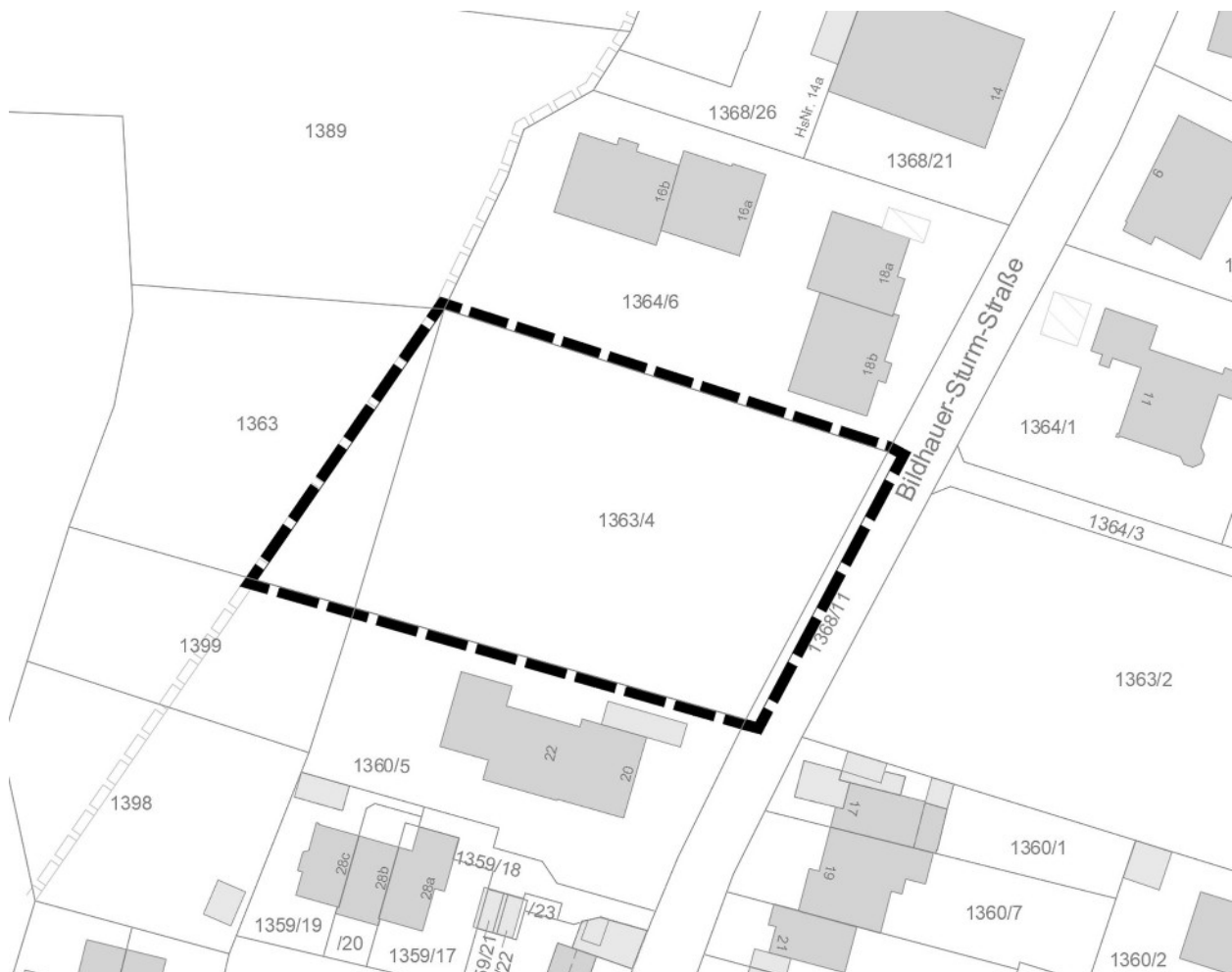
Abbildung 1: Lageplan des Geltungsbereiches , unmaßstäblich

Das Plangebiet weist eine Größe von ca. 0,3 ha auf. Maßgeblich ist die Bebauungsplanzeichnung.