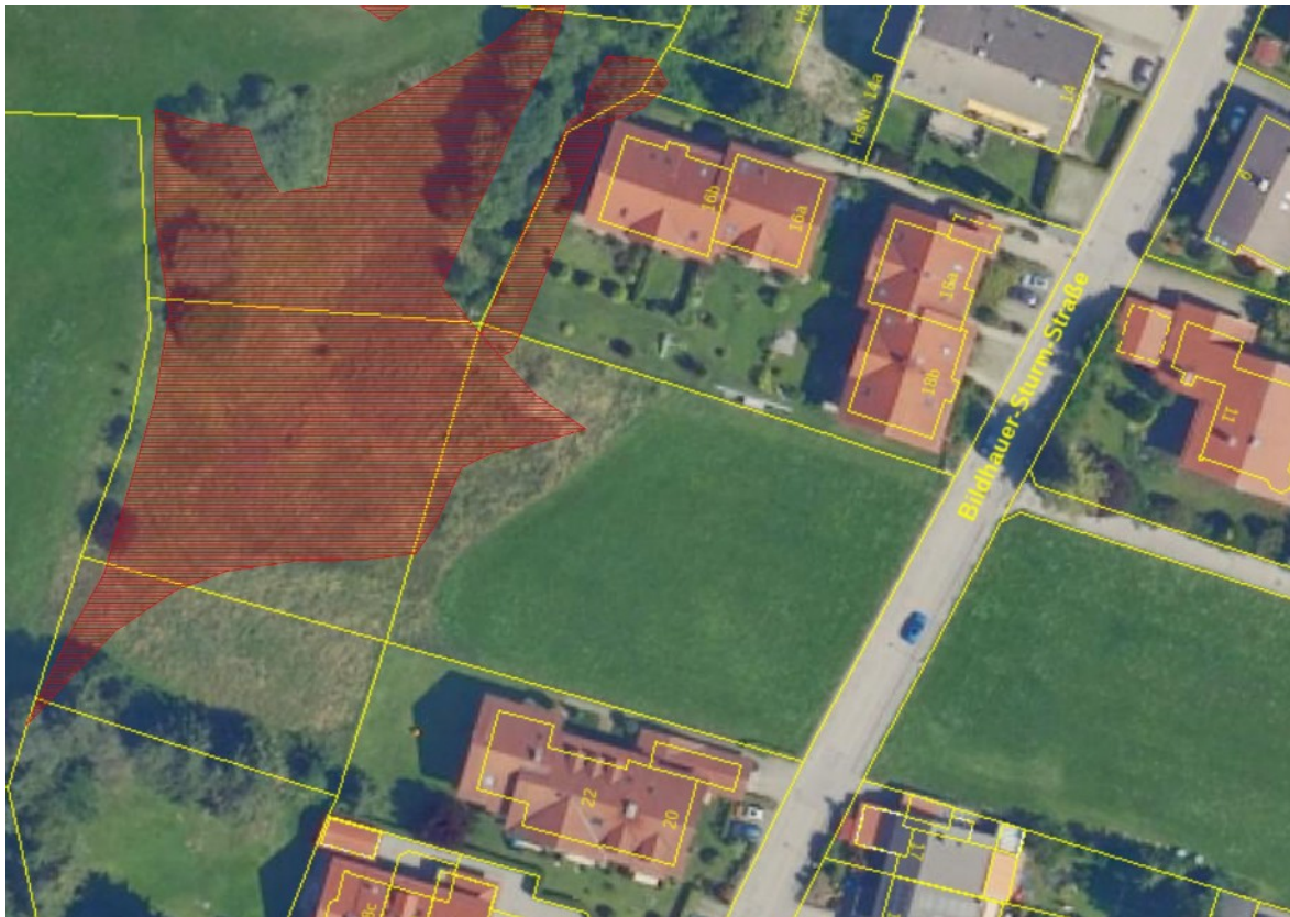
Abbildung 2: Luftbild mit Parzellierung (gelb) und Flachlandkartierung (rot), bayernatlas / LfU, unmaßstäblich

Bemerkung: Teil d. überregional bed. Gesamtkomplexes Galgenbichel; P(17): Blasmus compressus , Schoenus ferrugineus , Allium carinatum , Epipactis palustris , Filipendula vulgaris , Gentiana asclepiadea , G. pneumonanthe , Parnassia palustris , Scorzonera humilis , Schutzstatus nach BayNatSchG“