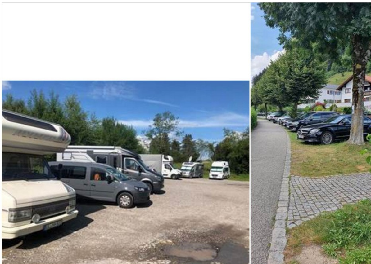
Abbildung 2: (Wild-)Parken im Bereich der Ortslage Hopfen 2