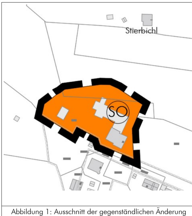
Abbildung 1: Ausschnitt der gegenständlichen Änderung

Die Stadt Füssen verfügt über einen wirksamen Flächennutzungsplan mit integriertem Landschaftsplan. Der Flächennutzungsplan wurde mit Bescheid vom 06.10.1987 Nr. 420-4621/201.4 von der Regierung von Schwaben genehmigt und ist seit seiner öffentlichen Bekanntmachung am 02.01.1989 verbindlich. In einigen Bereichen wurde dieser Flächennutzungsplan bereits mehrfach geändert. Der gegenständliche Bereich wird aktuell noch als Fläche für die Landwirtschaft dargestellt, die eine besondere ökologische orts- und landschaftsgestalterische Bedeutung hat. Die damals schon bestehende Hofstelle mit Stall hat keine gesonderte Flächendarstellung erfahren. Eine Durchwegung durch die Flächen ist ebenfalls Bestandteil der bisherigen Darstellungen.