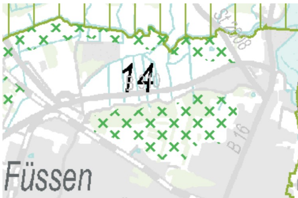
Abbildung 3: Ausschnitt aus Karte 3 - Natur und Landschaft des RP 16