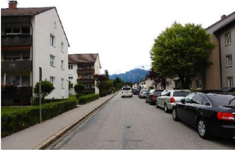
Abbildung 33: Welfenstraße