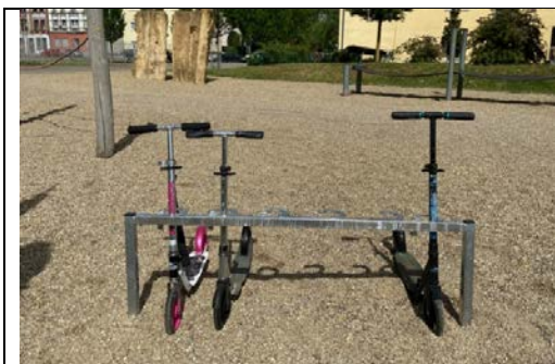
Abb. 1 Bsp. Rollerständer mit 6 Einstellplätzen, Fa. Schake

Als zusätzlicher Wetterschutz wäre eine einfache freitragende, feuerverzinkte Stahlkonstruktion mit Blecheindeckung (Abb. 2) denkbar.