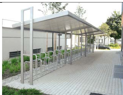
Abb. 2 Bsp. Fahrradständerüberdachung der Fa. Gronard mit ADFC-zertifizierten Fahrradständer Typ Kappa.