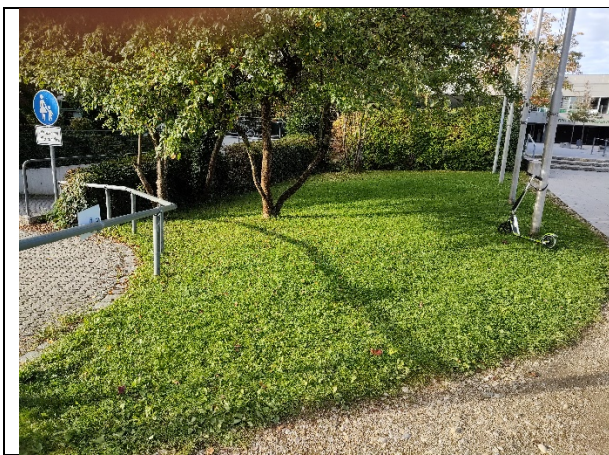
1. Talhofstraße, nördlich der Fahrradkeller-Zufahrt unter den Bäumen

Aus unserer Sicht scheinen folgende Platzierungen grundsätzlich geeignet: