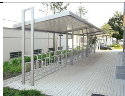
Abb. 2 Bsp. Fahrradständerüberdachung der Fa. Gronard mit ADFC-zertifizierten Fahrradständer Typ Kappa.