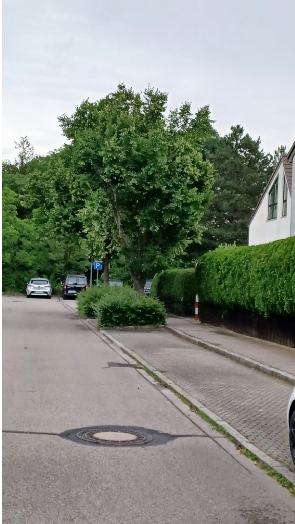
Aufnahmen vom 22.06.2022