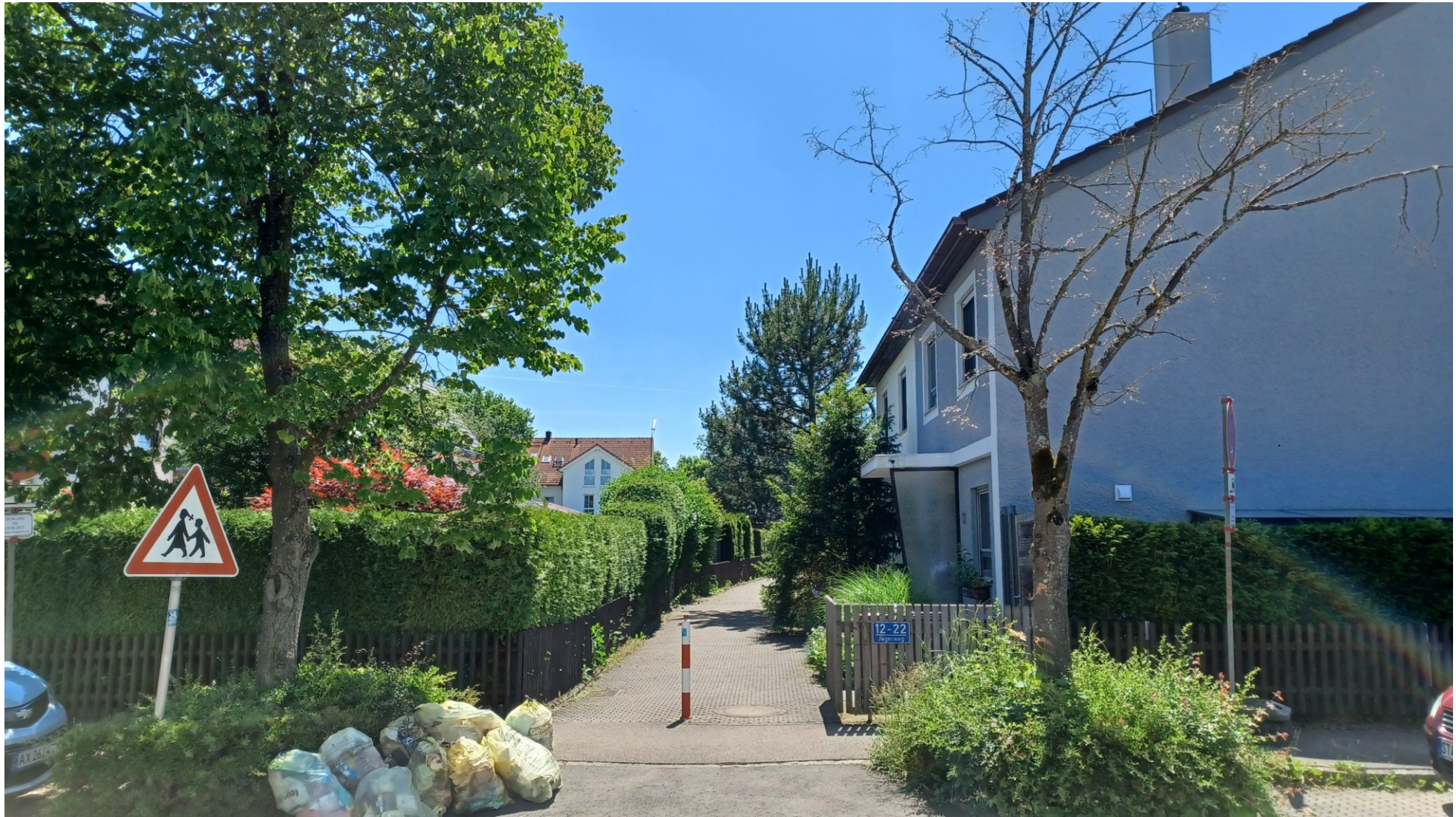
Aufnahme vom 14.06.2022