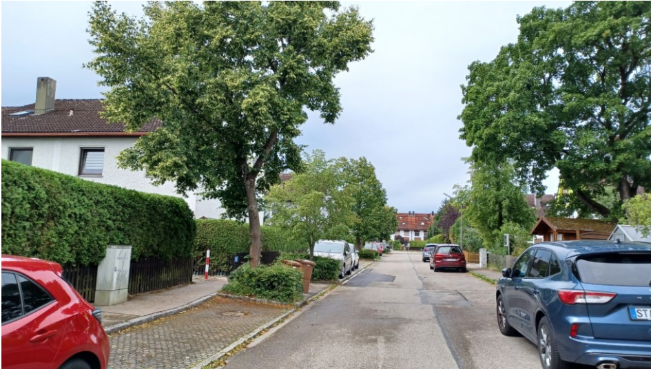
Aufnahmen vom 01.08.2023