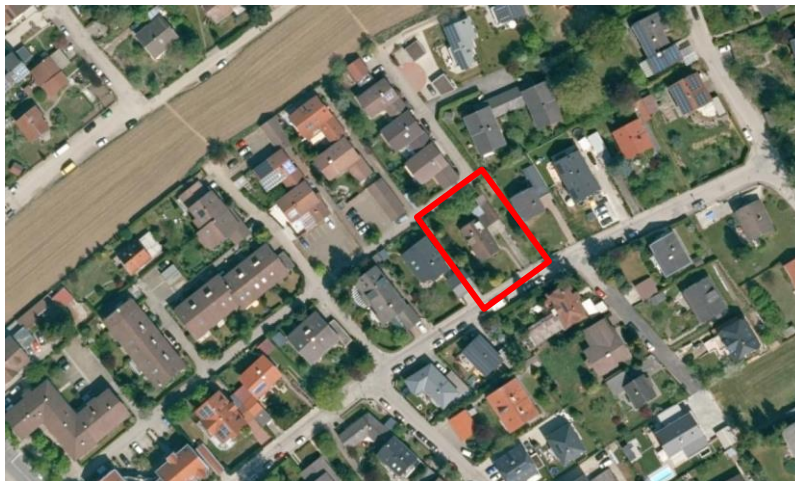
Abb. 4 Lage des Plangrundstücks im Luftbild, ohne Maßstab, Quelle: BayernAtlas, © Bayerische Vermessungsverwaltung, Stand Nov. 2022

Geändert werden die Größe und die Lage des Bauraums. Die Baugrenze wird, wie im Beschluss des Gemeinderates vorgesehen, auf 16 x 11 m vergrößert und die Lage auf die erkennbare vordere Raumkante der Bestandsgebäude in der Nachbarschaft (z.B. Fl.Nrn. 1219/21 und 1219/11) abgestimmt. Alle übrigen Planinhalte des ursprünglichen Bebauungsplans und dessen Teiländerungen gelten uneingeschränkt fort.