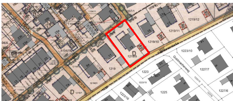
Abb. 3 aktuelle digitale Flurkarte mit rechtsverbindlichen Bebauungsplan Reißweg Süd, ohne Maßstab, eigene Darstellung