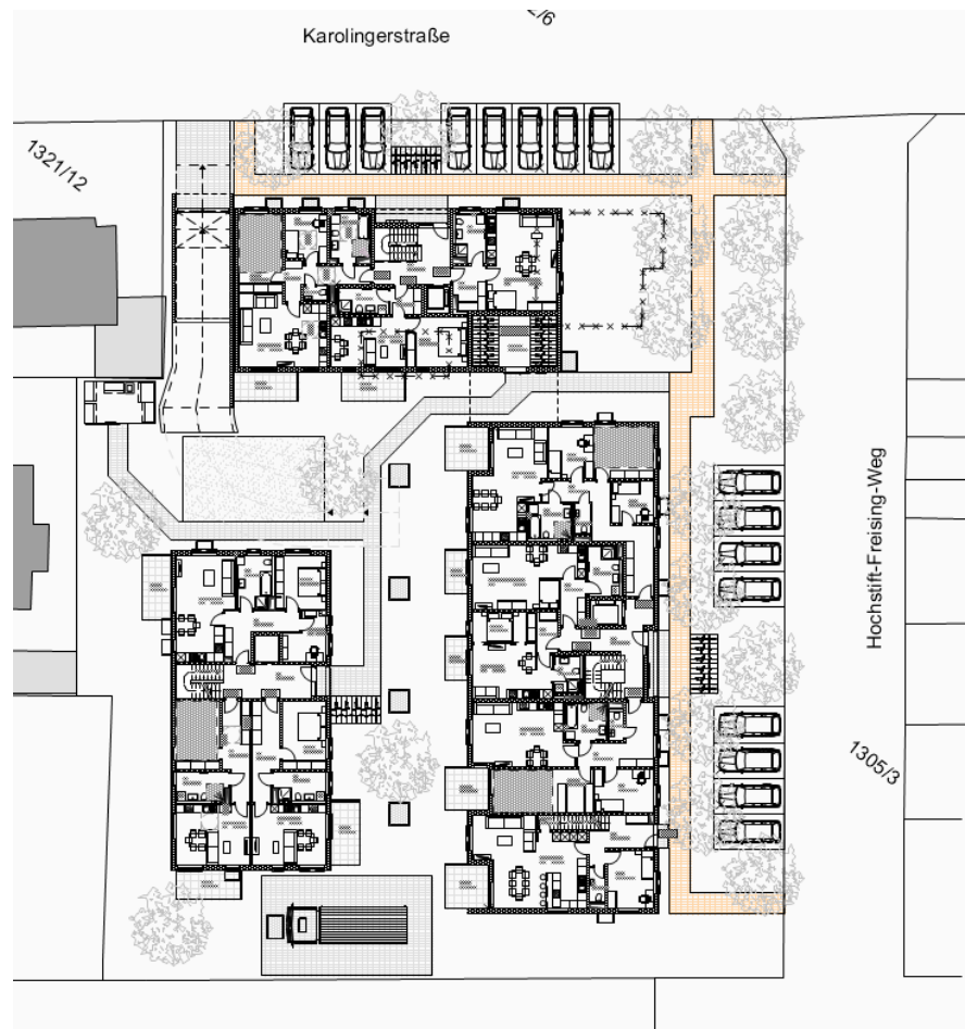
Entwurfsplanung, Friedl Architektur November 2022

Unter Berücksichtigung des abgestimmten städtebaulichen Konzeptes wurde folgende Entwurfsplanung entwickelt und in zwei Sitzungen mit einem temporären Gestaltungsbeirat und der Gemeinde Gilching abgestimmt: