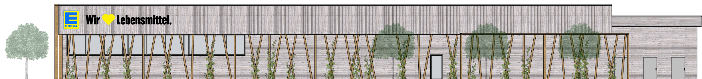
ANSICHT VON OSTEN M 1:200