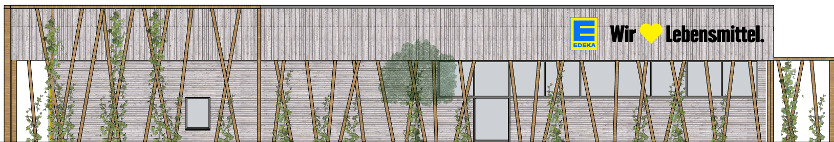
ANSICHT VON SÜDEN M 1:200