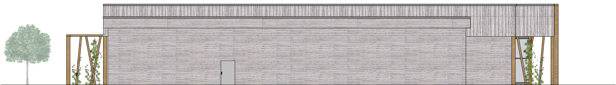
ANSICHT VON NORDEN M 1:200