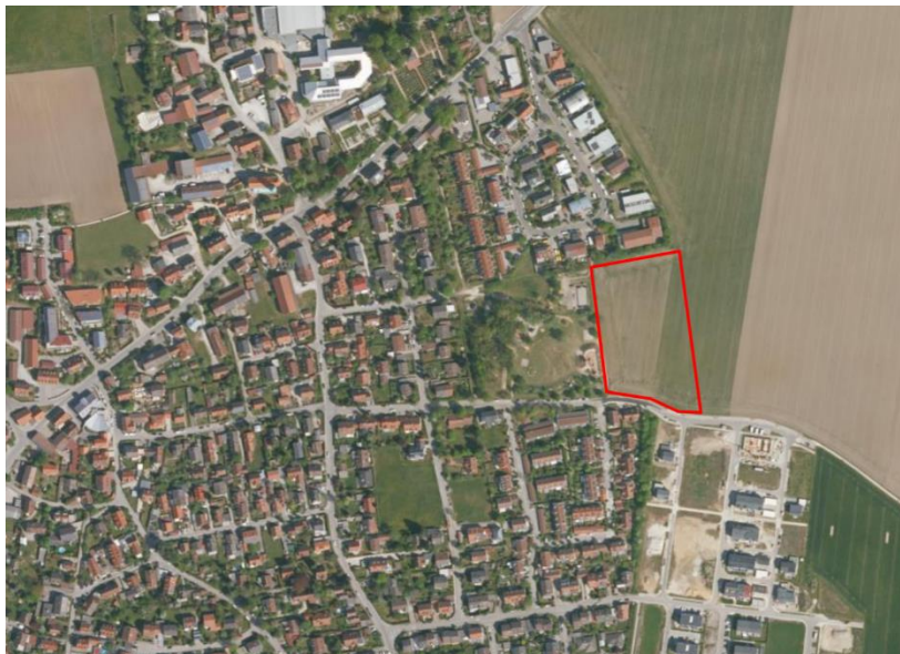
Abb. 1 Plangebiet, ohne Maßstab, Quelle: BayernAtlas, © Bayerische Vermessungsverwaltung, Stand 10.2022

Das Plangebiet liegt am östlichen Siedlungsrand des Hauptortes Haimhausen. Es umfasst einen 1,28 ha großen Teilbereich der Fl.Nr. 283 (Gemarkung Haimhausen), der direkt westlich an das Gelände des Abenteuerspielplatzes anschließt.