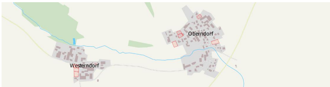
Abbildung 4: Bestehende Innenentwicklungspotenziale in den Ortsteilen Westerndorf und Oberndorf nach Auskunft der Gemeindeverwaltung im November 2022