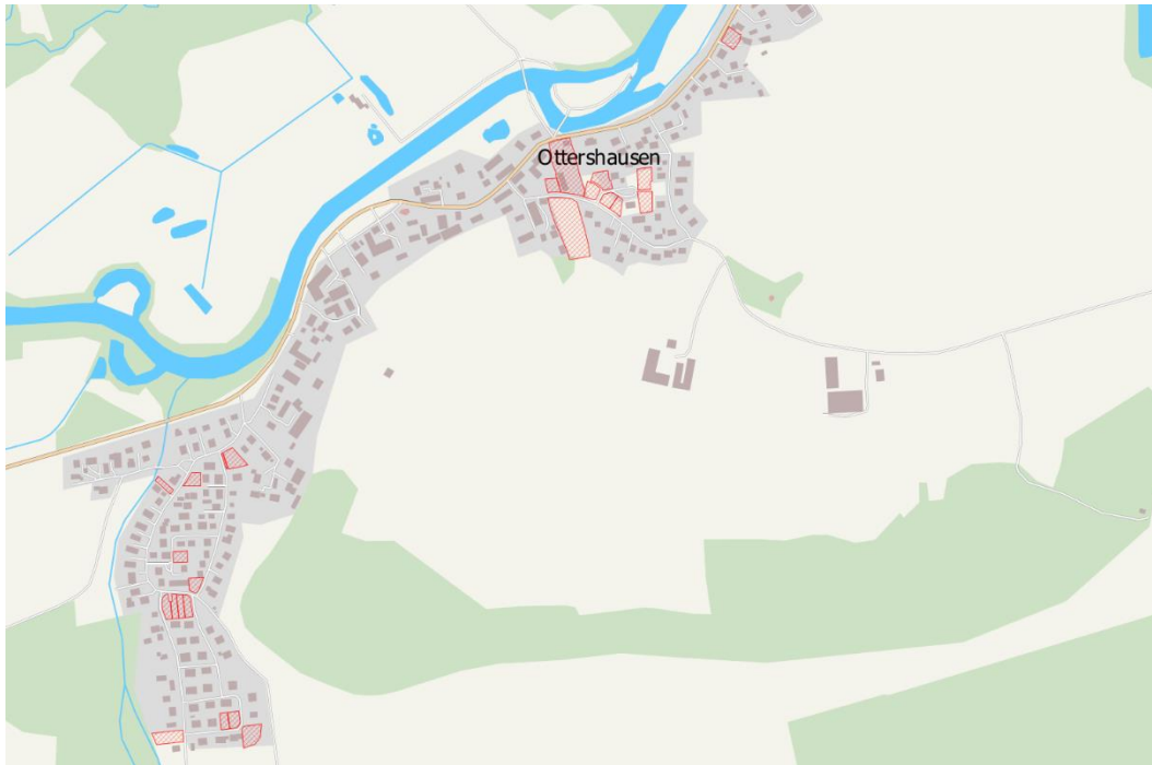
Abbildung 3: Bestehende Innenentwicklungspotenziale im Hauptort Haimhausen nach Auskunft der Gemeindeverwaltung im November 2022