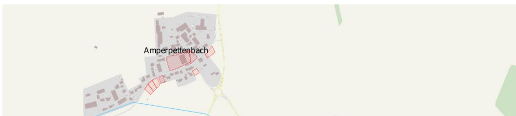
Abbildung 5: Bestehende Innenentwicklungspotenziale im Ortsteil Amperpettenbach nach Auskunft der Gemeindeverwaltung im November 2022