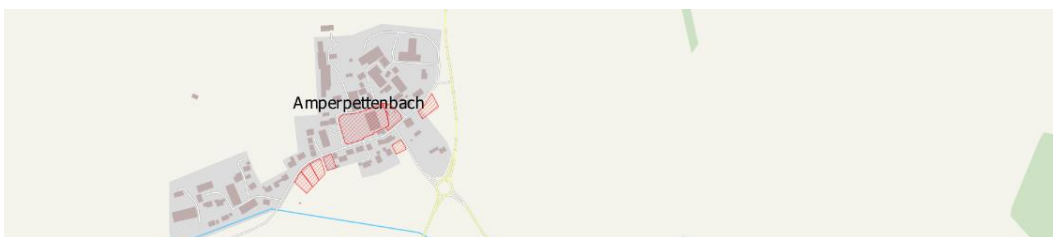
Abbildung 5: Bestehende Innenentwicklungspotenziale im Ortsteil Amperpettenbach nach Auskunft der Gemeindeverwaltung im November 2022