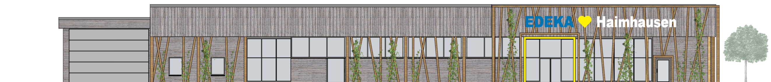
ANSICHT VON WESTEN M 1:200