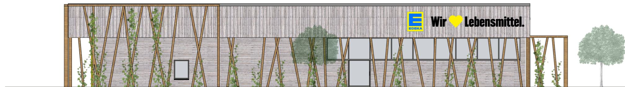
ANSICHT VON SÜDEN M 1:200