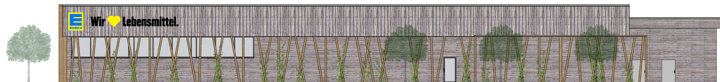
ANSICHT VON OSTEN M 1:200