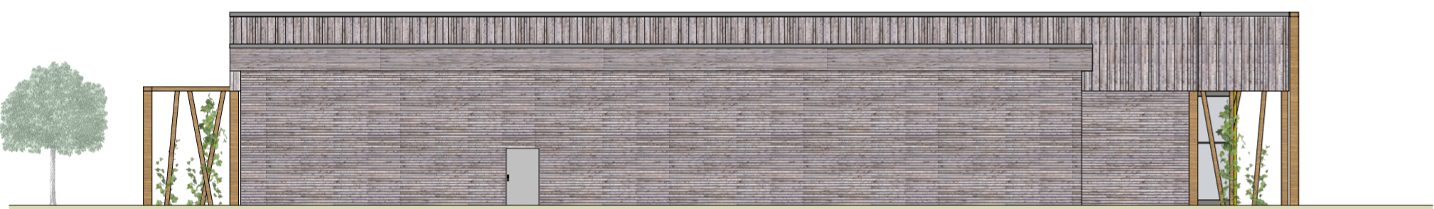
ANSICHT VON NORDEN M 1:200