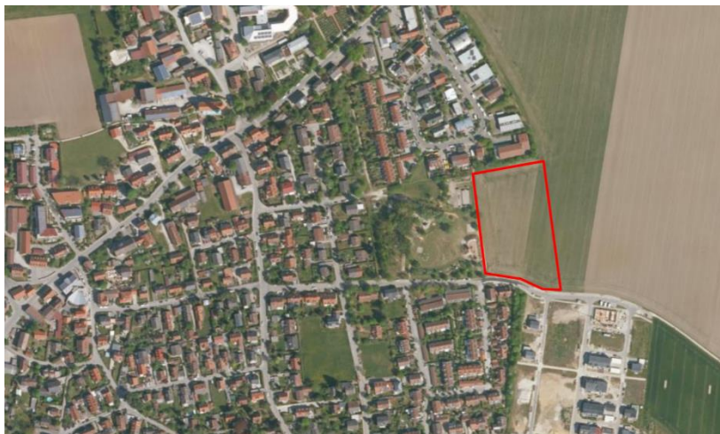
Abb. 1 Plangebiet, ohne Maßstab, Quelle: BayernAtlas, © Bayerische Vermessungsverwaltung, Stand 10.2022

Das ‚Plangebiet‘ – gemeint ist im Folgenden immer die Fläche am östlichen Siedlungsrand des Hauptortes Haimhausen ohne die externe Ausgleichsfläche – umfasst einen 1,28 ha großen Teilbereich der Fl.Nr. 283 (Gemarkung Haimhausen), der direkt westlich an das Gelände des Abenteuerspielplatzes anschließt.