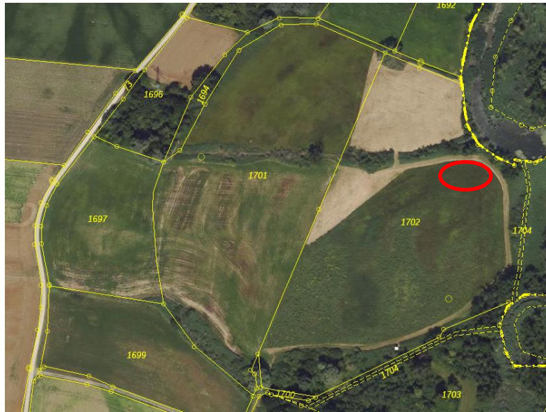
Abb. 4: Luftbild mit Flurkarte, © Bayerische Vermessungsverwaltung, Stand 08/2023