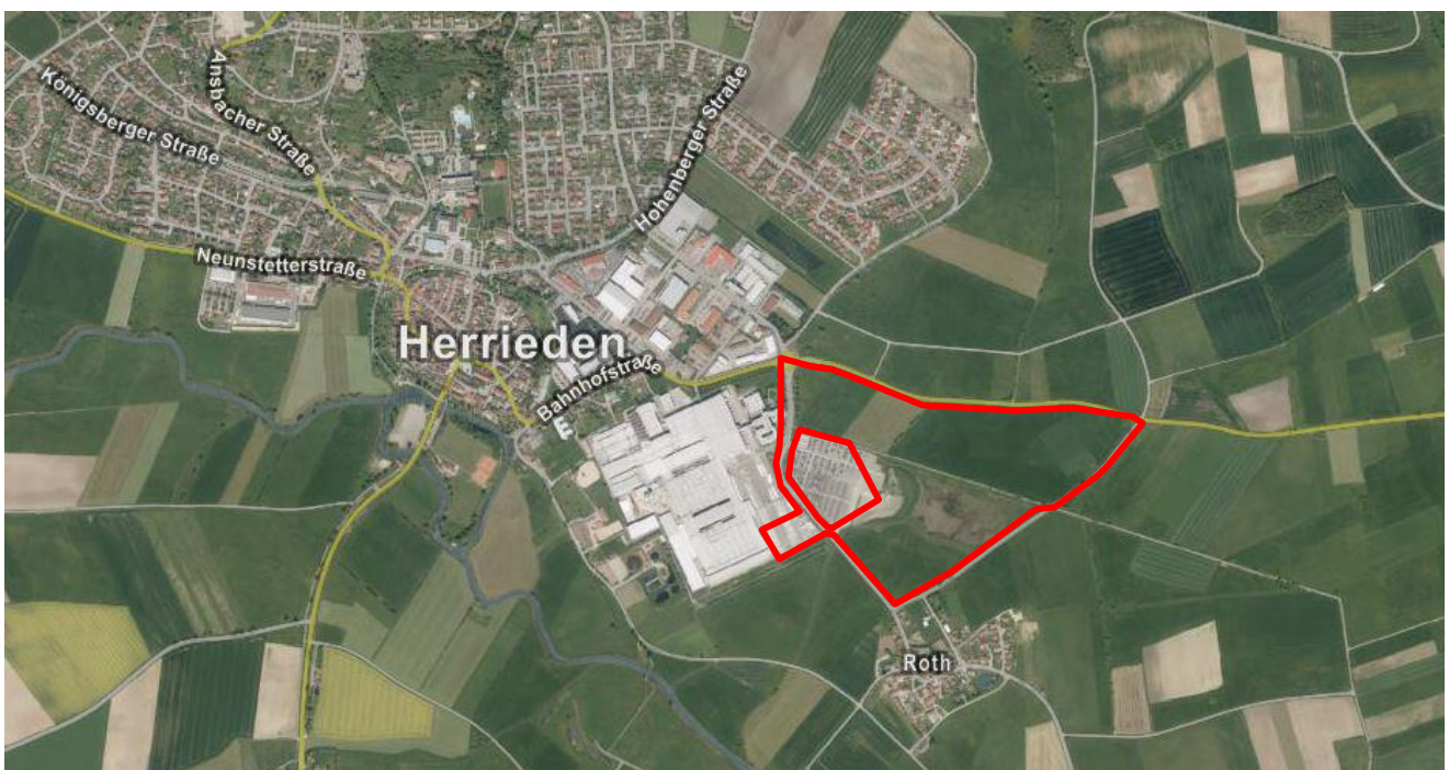
(Luftbild mit Geltungsbereich der Änderung)

Die gewerbliche Baufläche befindet sich am südöstlichen Ortsrand der Stadt Herrieden, südlich der Staatsstraße 2249 Richtung Burgoberbach. Westlich grenzt das bestehende Firmengelände der Firma Schüller Möbelwerk KG an.