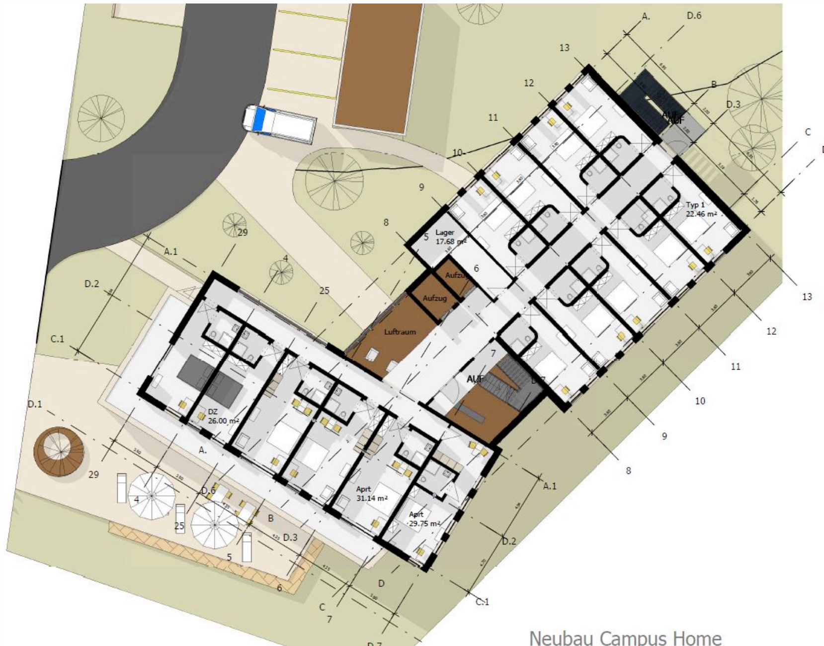
Neubau Campus Home