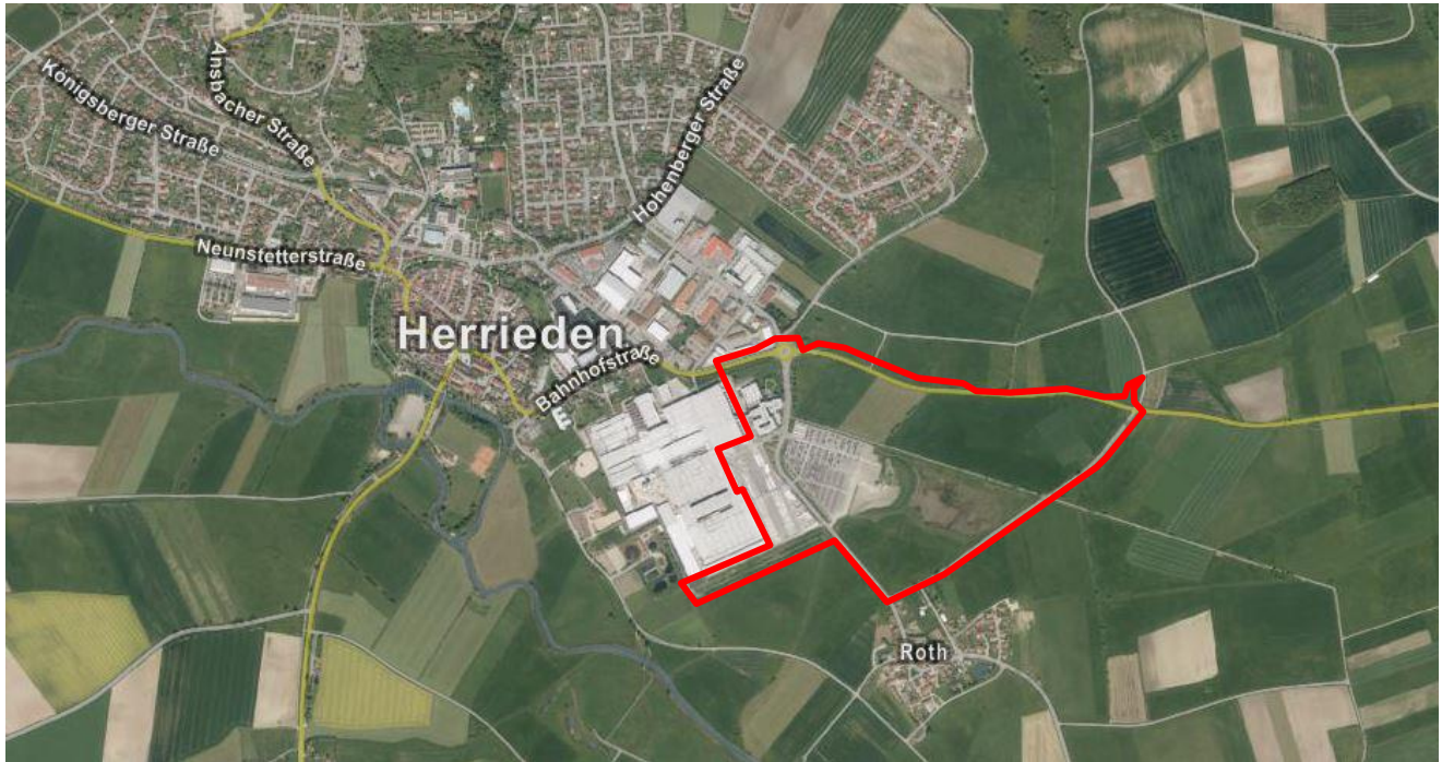
(Luftbild mit Geltungsbereich)

Der Geltungsbereich des Bebauungsplanes Nr. 19 für das Gewerbegebiet „Rother Straße“ befindet sich am südöstlichen Ortsrand der Stadt Herrieden, südlich der Staatsstraße 2249 Richtung Burgoberbach. Westlich grenzt das bestehende Firmengelände der Firma Schüller Möbelwerk KG an.