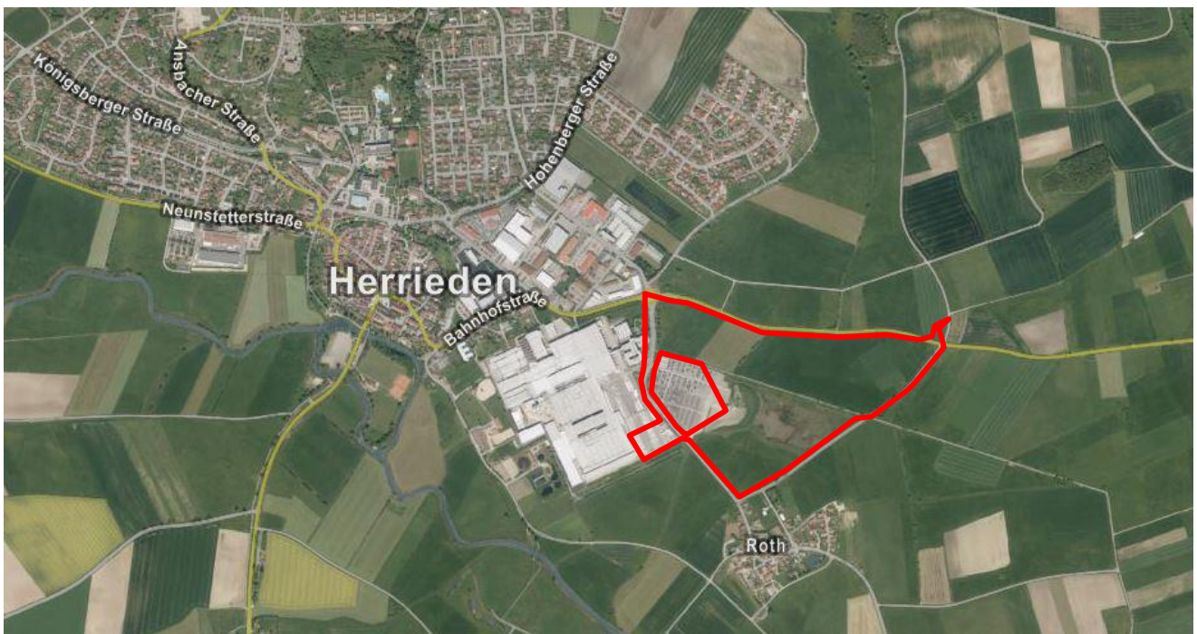
(Luftbild mit Geltungsbereich der Änderung)

Die gewerbliche Baufläche befindet sich am südöstlichen Ortsrand der Stadt Herrieden, südlich der Staatsstraße 2249 Richtung Burgoberbach. Westlich grenzt das bestehende Firmengelände der Firma Schüller Möbelwerk KG an.