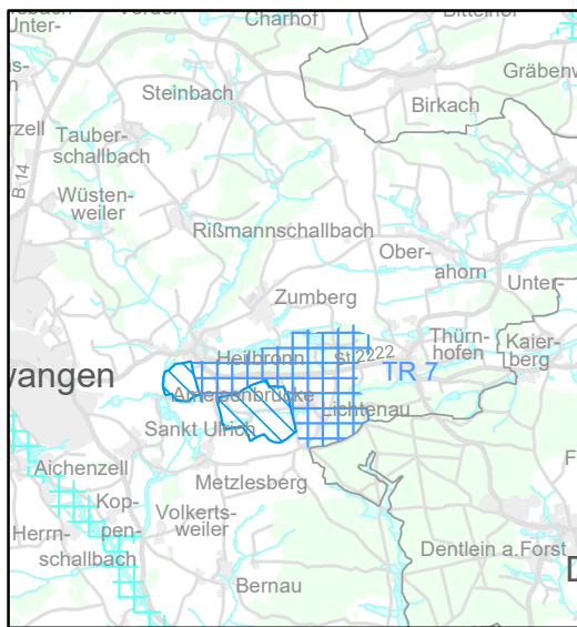
rechtsverbindlicher Stand im Regionalplan

Stadt/Gemeinde: Dentlein a.Forst, Feuchtwangen (Lkr. Ansbach)