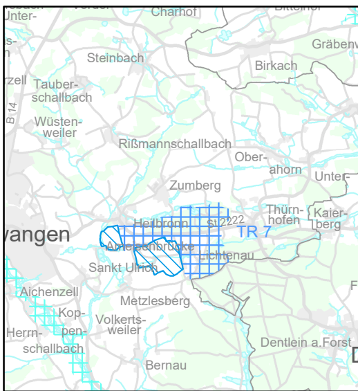
rechtsverbindlicher Stand im Regionalplan

Stadt/Gemeinde: Dentlein a.Forst, Feuchtwangen (Lkr. Ansbach)