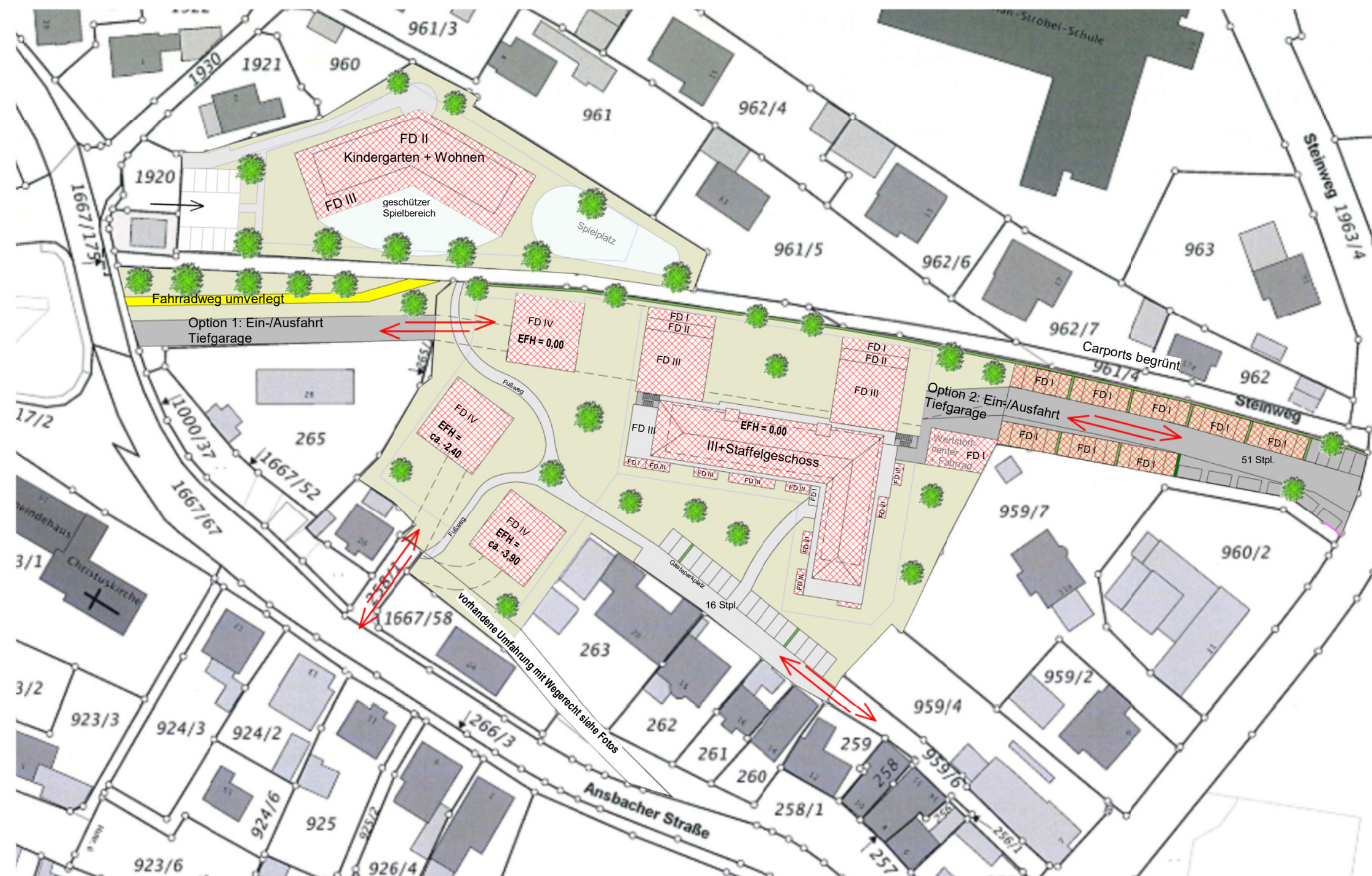
Lageplan M 1 : 1000