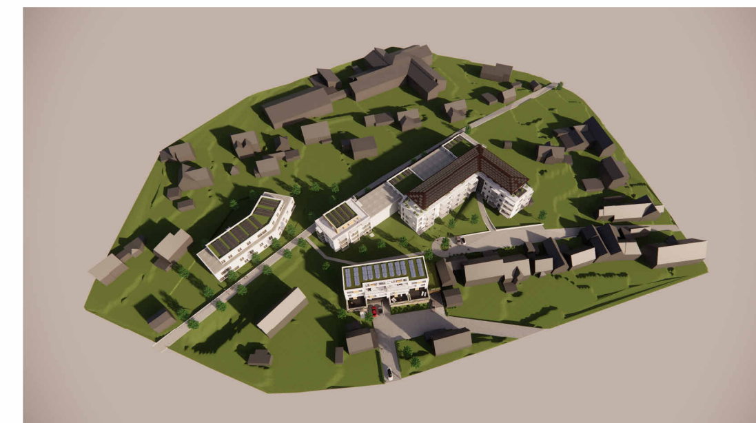
Vogelperspektive Sonnenstand 17.01.2022 12 Uhr (Massenmodell alte Fabrikhalle + neue Bebauung)