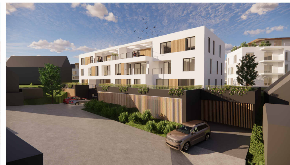
Perspektive: Einfahrt Tiefgarage MFH Ansbacher Straße (zur Illustration- keine Gebäudeplanung)