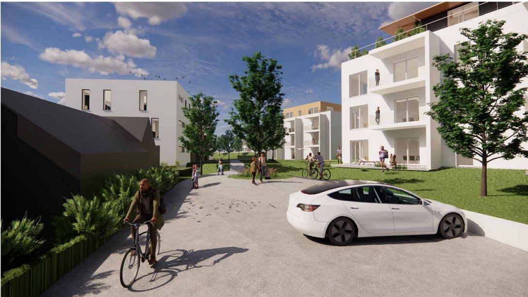
Perspektive Bereich Gästeparken (zur Illustration- keine Gebäudeplanung)