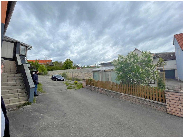
Bestand: Bereich Wegerecht zur Ansbacher Straße