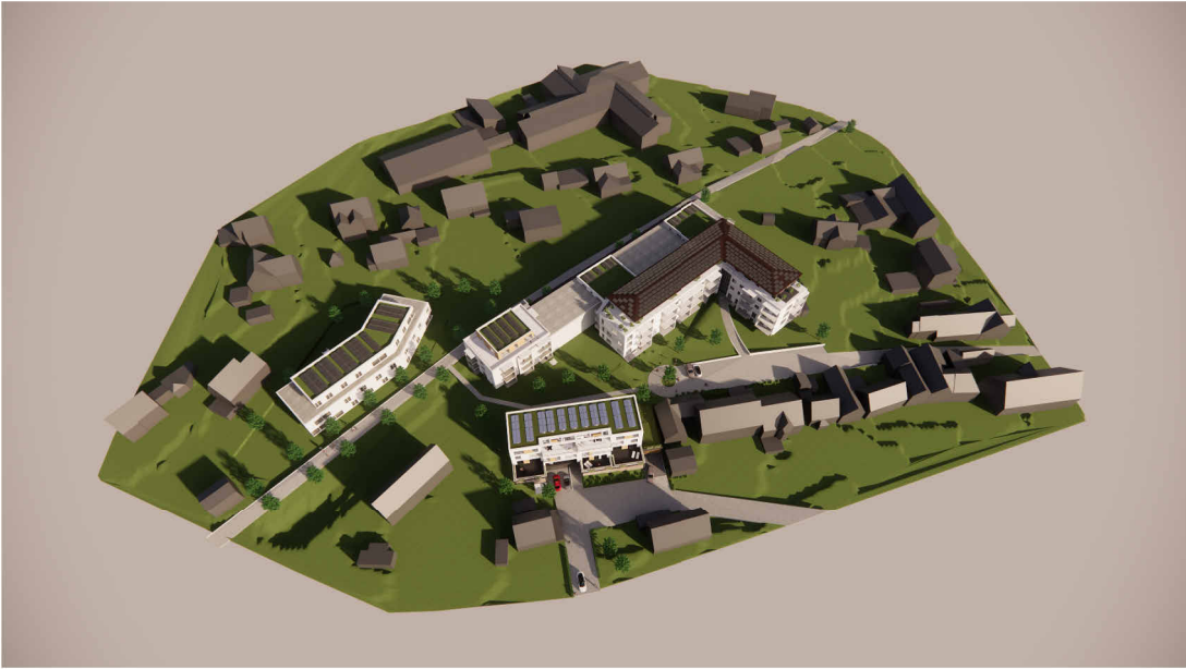
Vogelperspektive Sonnenstand 17.01.2022 12 Uhr (Massenmodell alte Fabrikhalle + neue Bebauung)