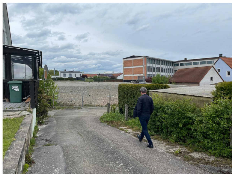
Bestand: Zufahrt von der Ansbacher Straße