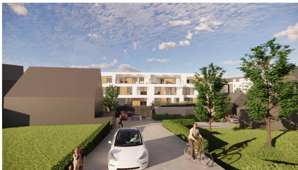
Perspektive: Zufahrt MFH von der Ansbacher Straße (zur Illustration- keine Gebäudeplanung)