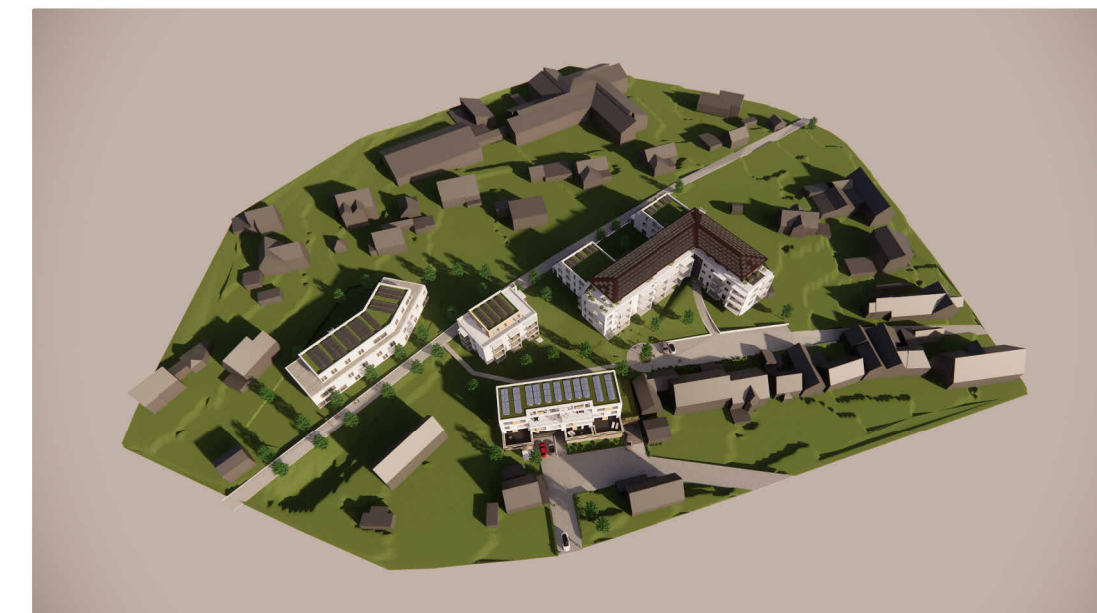
Vogelperspektive Sonnenstand 17.01.2022 12 Uhr (Neue Bebauung)

Höhenbezug: EFH Bestandsgebäude mit neuem Fußbodenaufbau = 436.28m üNN