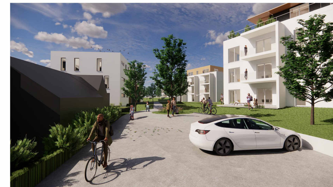
Perspektive Bereich Gästeparken (zur Illustration- keine Gebäudeplanung)