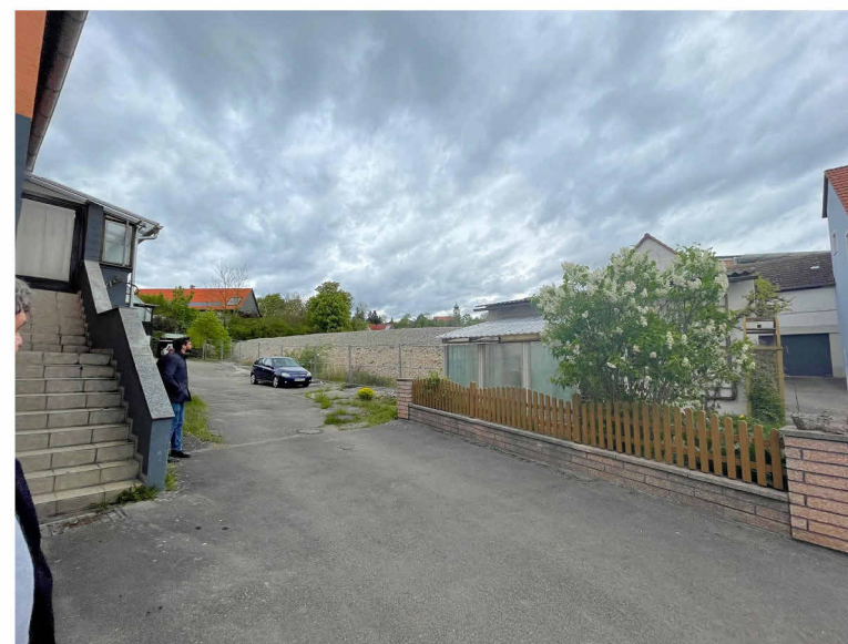
Bestand: Bereich Wegerecht zur Ansbacher Straße