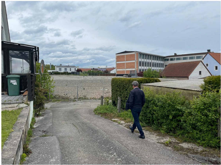
Bestand: Zufahrt von der Ansbacher Straße