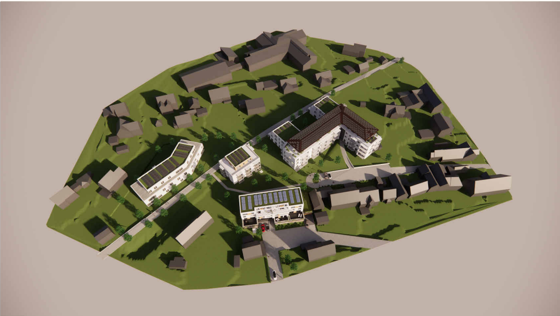
Vogelperspektive Sonnenstand 17.01.2022 12 Uhr (Neue Bebauung)

Höhenbezug: EFH Bestandsgebäude mit neuem Fußbodenaufbau = 436.28m üNN