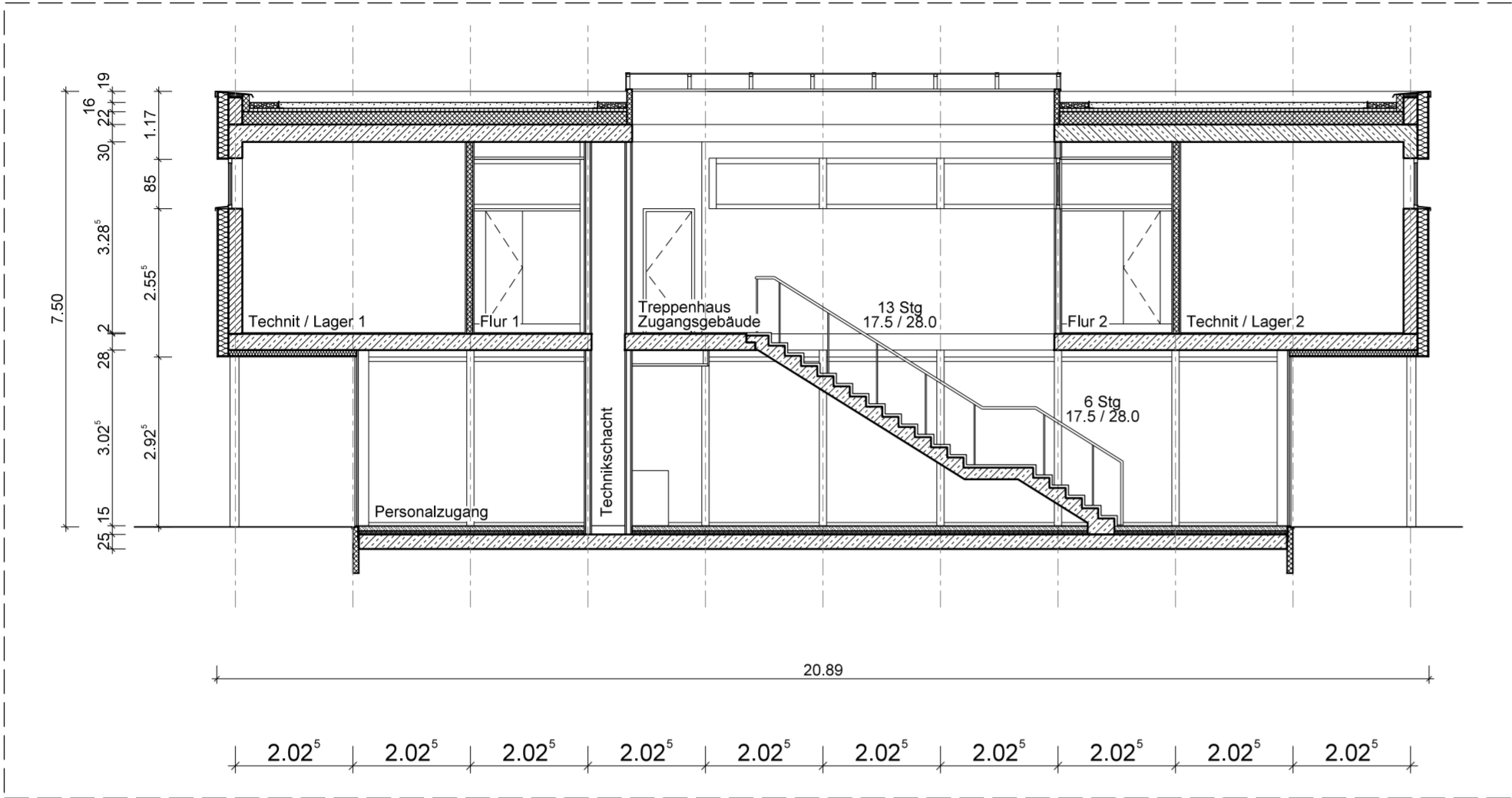
Schnitt 1-1 - Personalzugangsgebäude