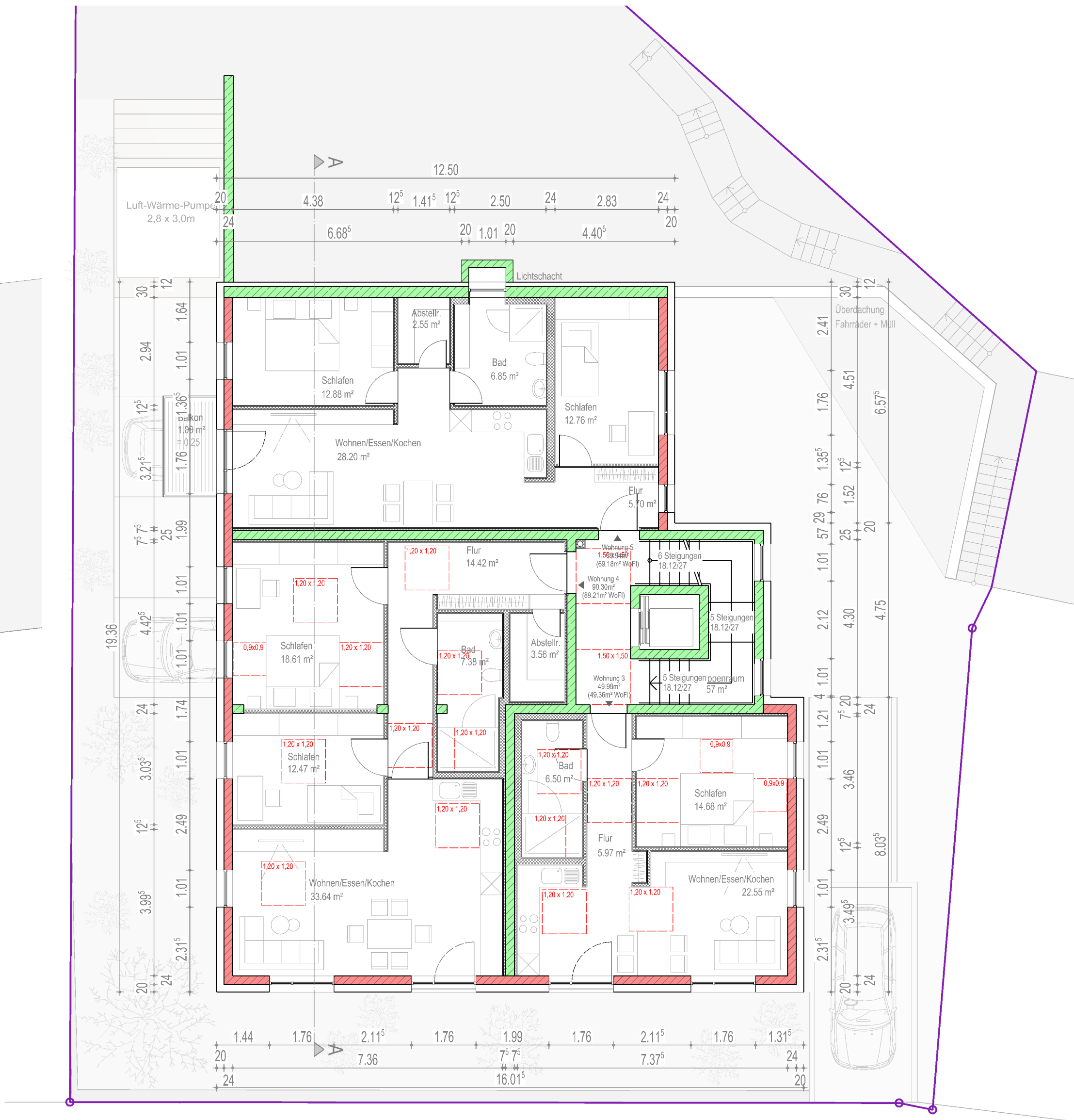
Grundriss 1. Obergeschoss