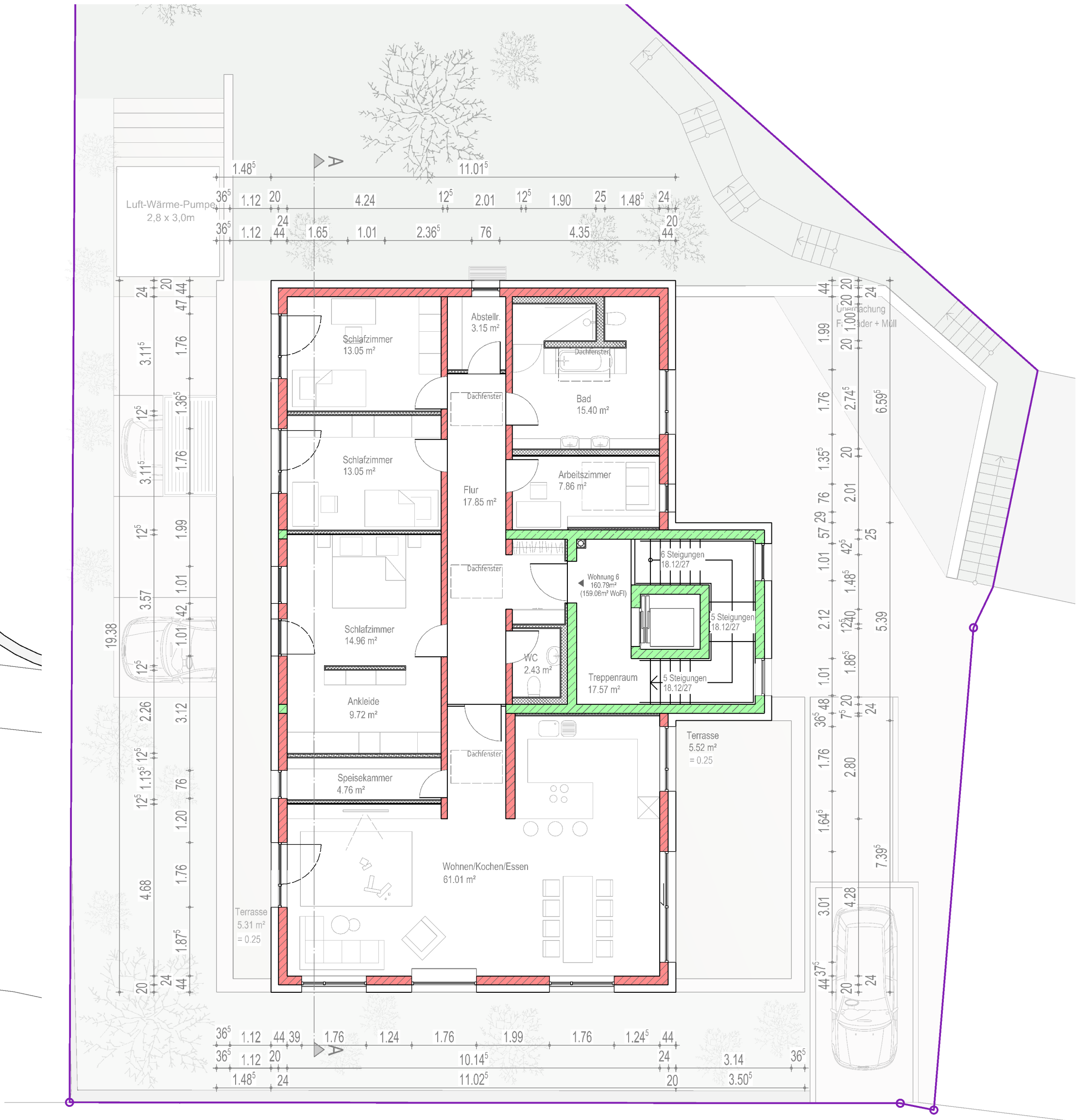
Grundriss 2. Obergeschoss