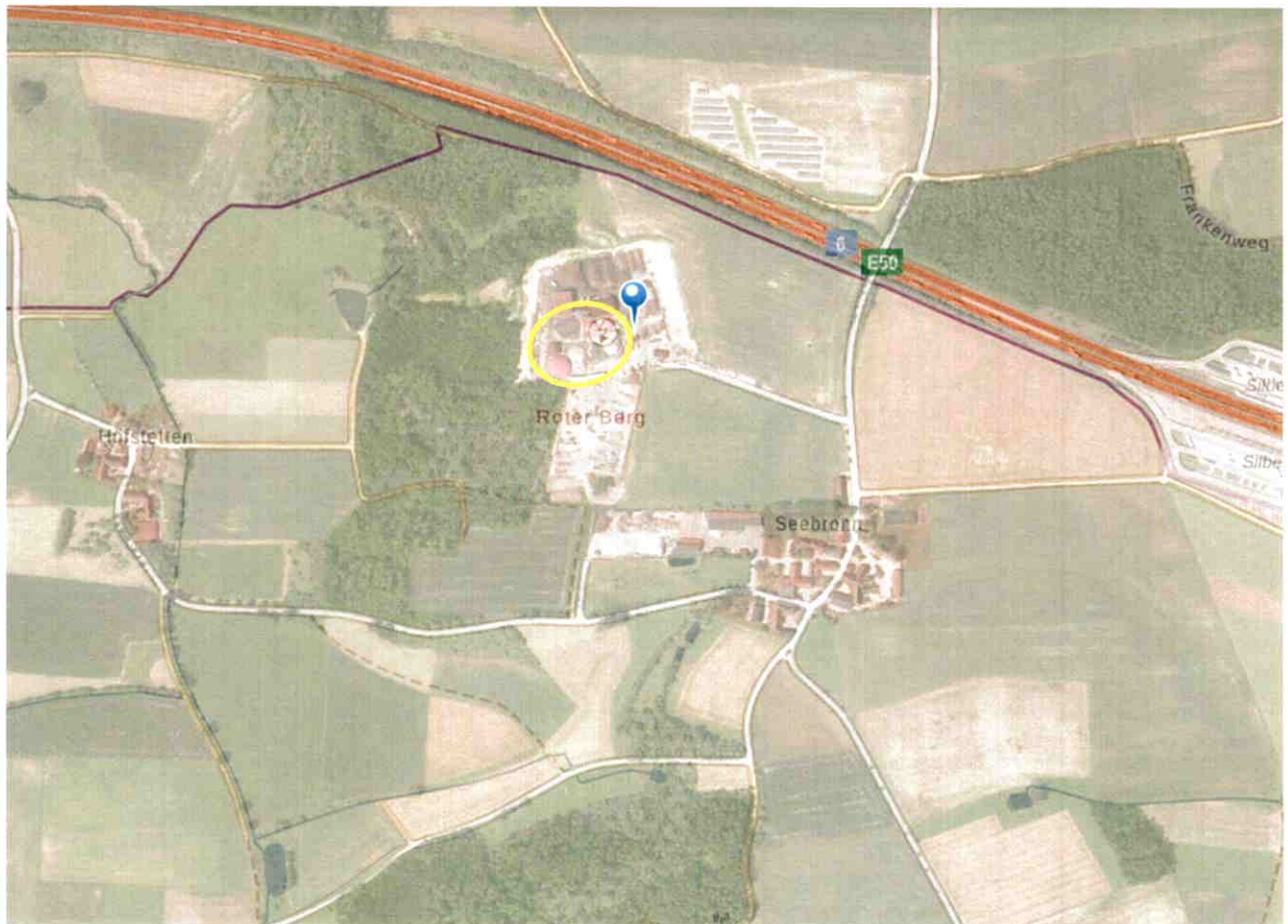
Abbildung 1: Lage der Anlage zur Erzeugung von Biogas

Die Anlage zur Erzeugung von Biogas befindet sich auf Flurstücksnummer 378 der Gemarkung Hohenberg. In der näheren Umgebung der Anlage befinden sich keine Gewässer, von denen Hochwassergefahren ausgehen könnten. Umliegend an die Anlage grenzen Wiesen- und Ackerland bzw. Waldgebiet an, welches keine besonders schützenswerten Strukturen aufweist. Die Zufahrt zur Anlage erfolgt über wenig befahrene Gemeindeverbindungsstraßen über Kurzendorf, Höfstetten und Rös zur Kreisstraße AN 55.