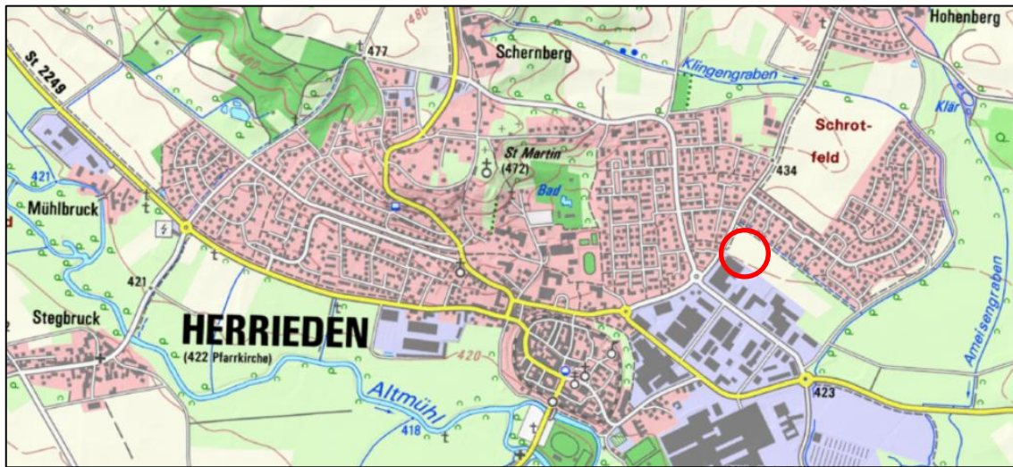
Abb. 1: Lage des Projektgebietes in Herrieden