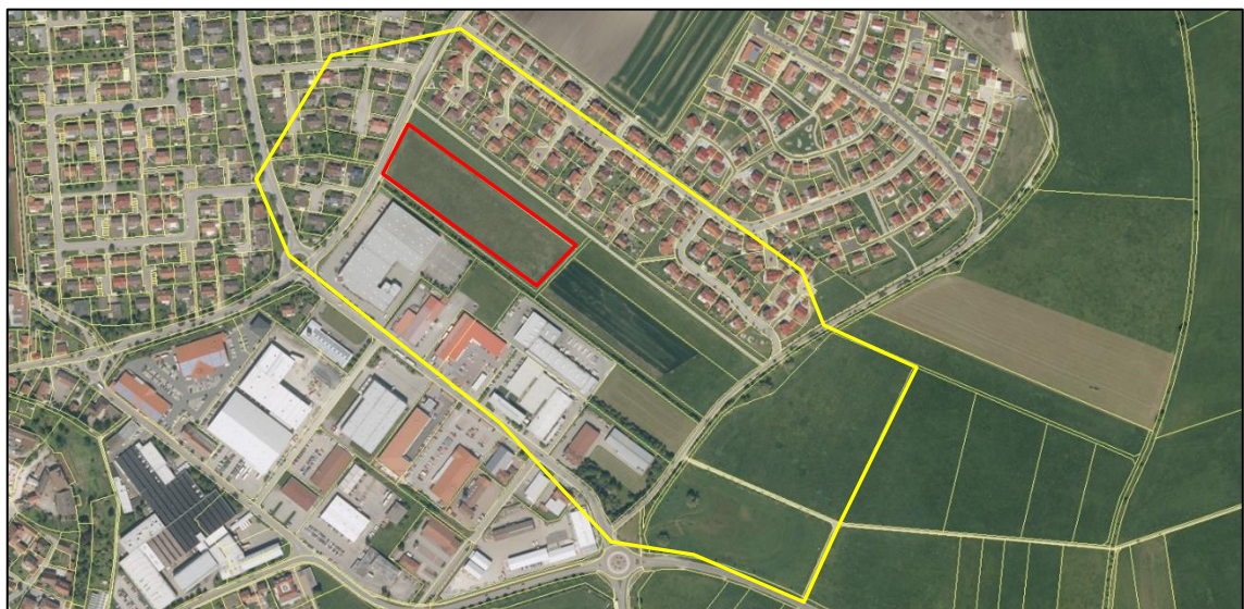
Abb. 2: Lage und Abgrenzung des Projektgebietes. Die rote Linie stellt das Grundstück des Bebauungsplanes dar. Gelb ist der Bewertungsraum dargestellt.

Das Grundstück liegt im Ortsbereich von Herrieden und ist von bestehender Wohn- und Gewerbebebauung, sowie im Südosten von intensiv genutzten landwirtschaftlichen Flächen umgeben. Auf der Fläche befindet sich intensiv genutztes Grünland, am Südwestrand eine Feldhecke.