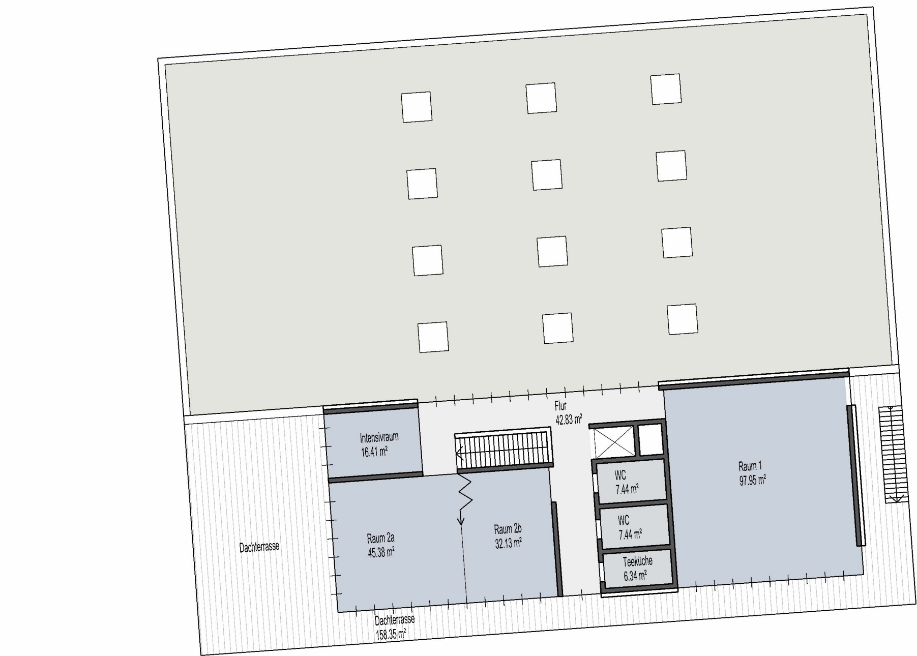
OPTIONAL GRUNDRISS OG (GANZTAG)