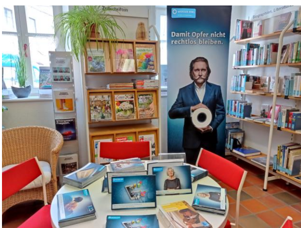
Ausstellung „weißer Ring“