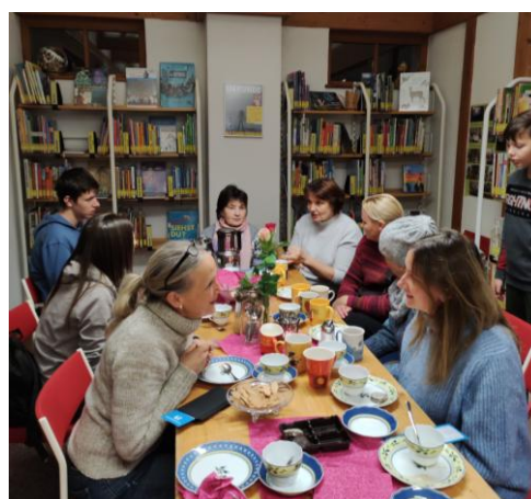
Büchereiführung für Flüchtlinge