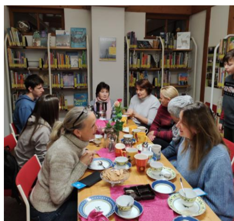
Büchereiführung für Flüchtlinge