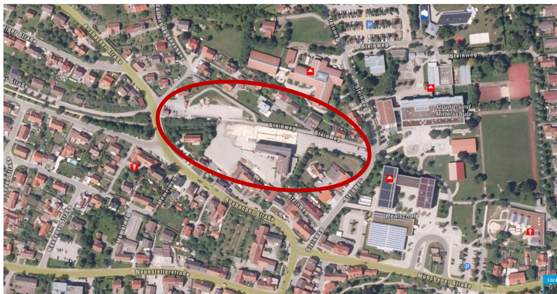
Plangebiet und Umgebung