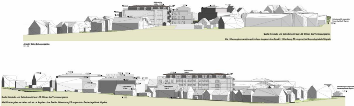
Bebauungskonzept – Verschattung – Variante „nur“ zukünftige Bebauung / Ansichten (obere Ansicht von Osten; untere Ansicht von Süden) (schneider architekten art; März 2022)