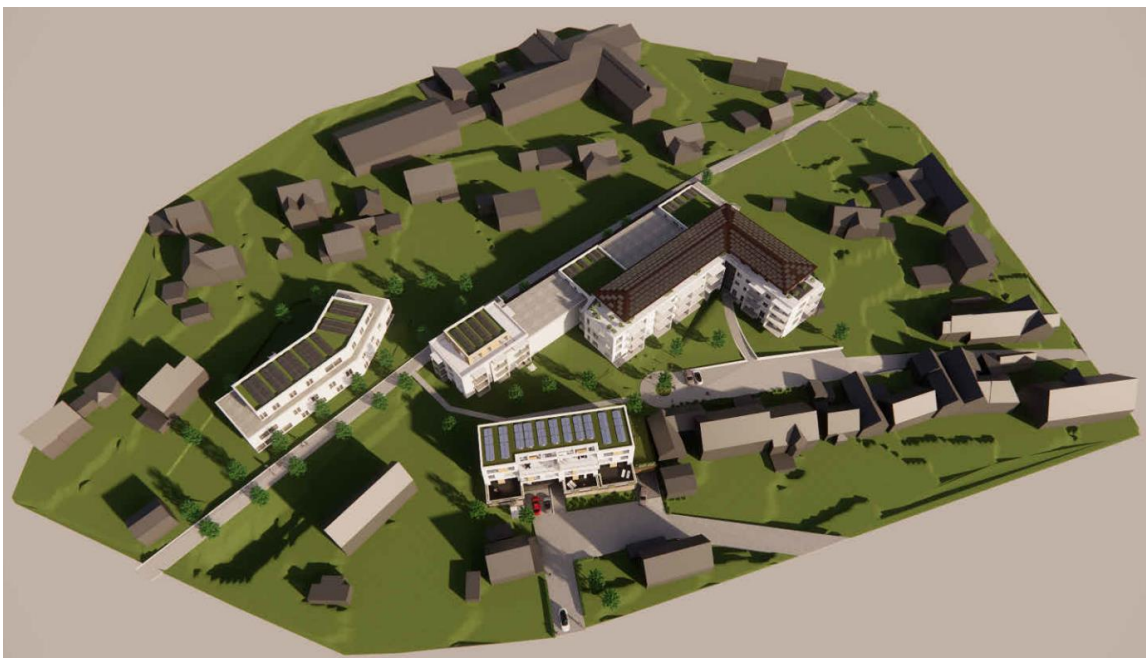
Belichtung/Besonnung am 17.01. – 12 Uhr (obere Darstellung: Variante „mögliche zukünftige Bebauung“; untere Darstellung: Variante „Kombination neue Bebauung mit früherer Fabrikhalle“) (schneider architekten art; März 2022)