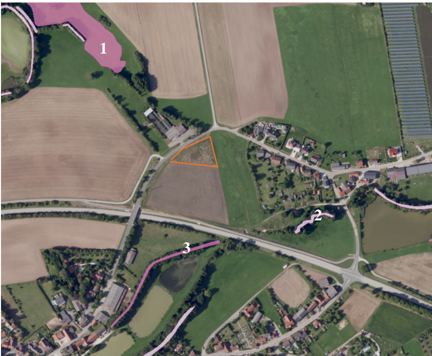
Luftbild mit Biotopen (Datenquelle: Bayerisches Fachinformationssystem Naturschutz)

In der Umgebung liegen folgende kartierte Biotopflächen der Bayerischen Biotopkartierung.