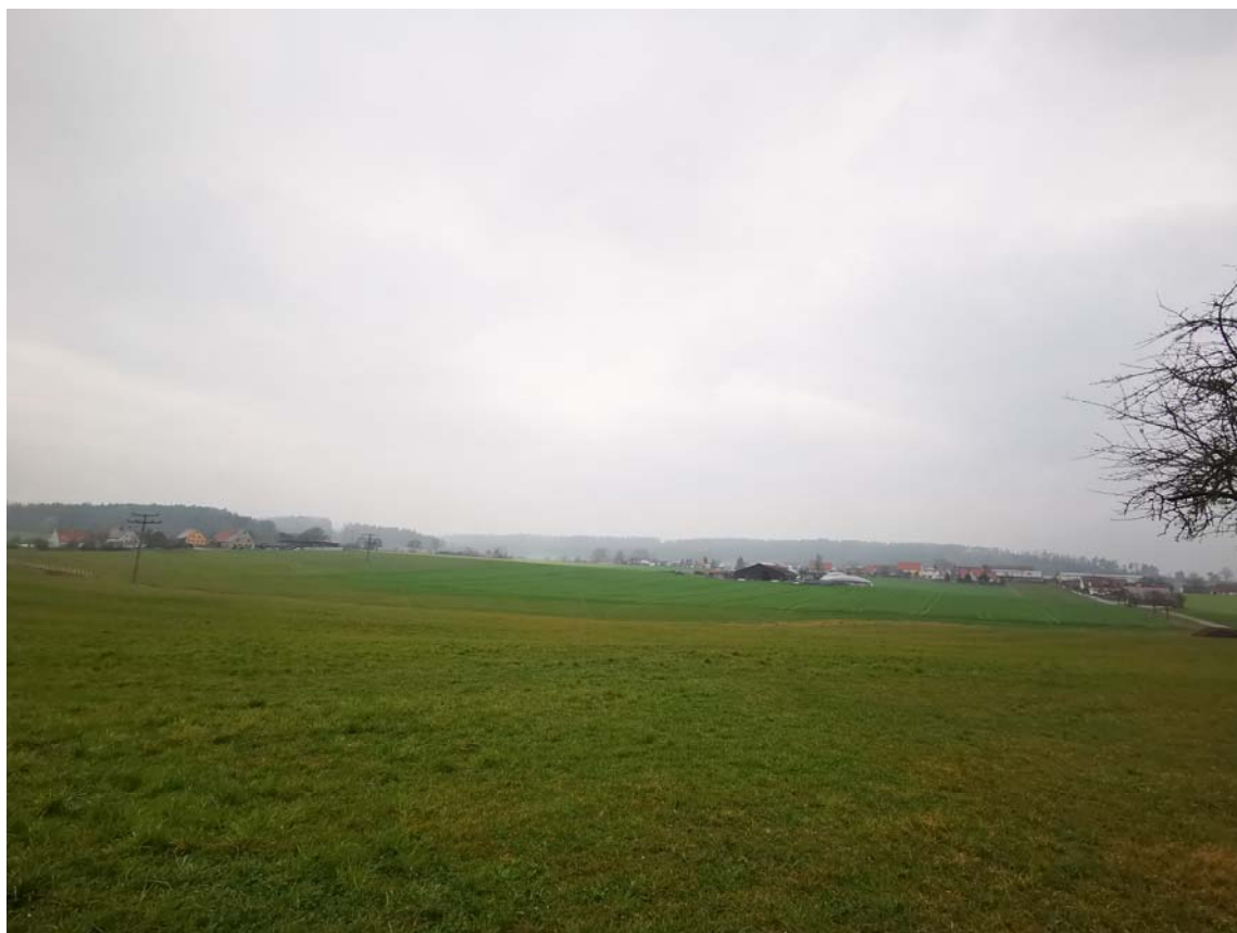
Abbildung 1: Vorhabensfläche mit Blick nach Norden

Geteilt ist die Vorhabensfläche durch ein Wegegrundstück (Fl.Nr. 2025) und einem schmalen Grünlandstreifen mit einer mittelalten Baumreihe (Fl.Nr. 2026).