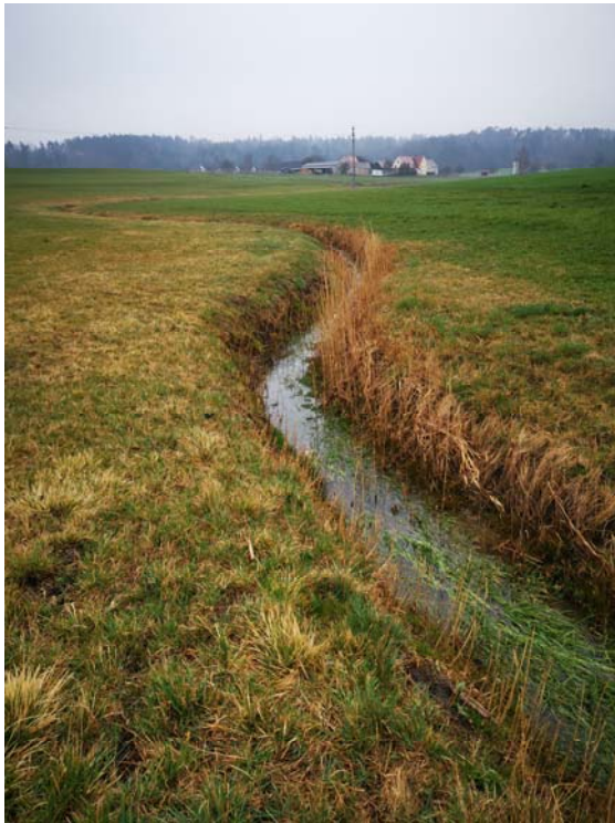
Abbildung 3: Schergraben südlich der Vorhabensfläche