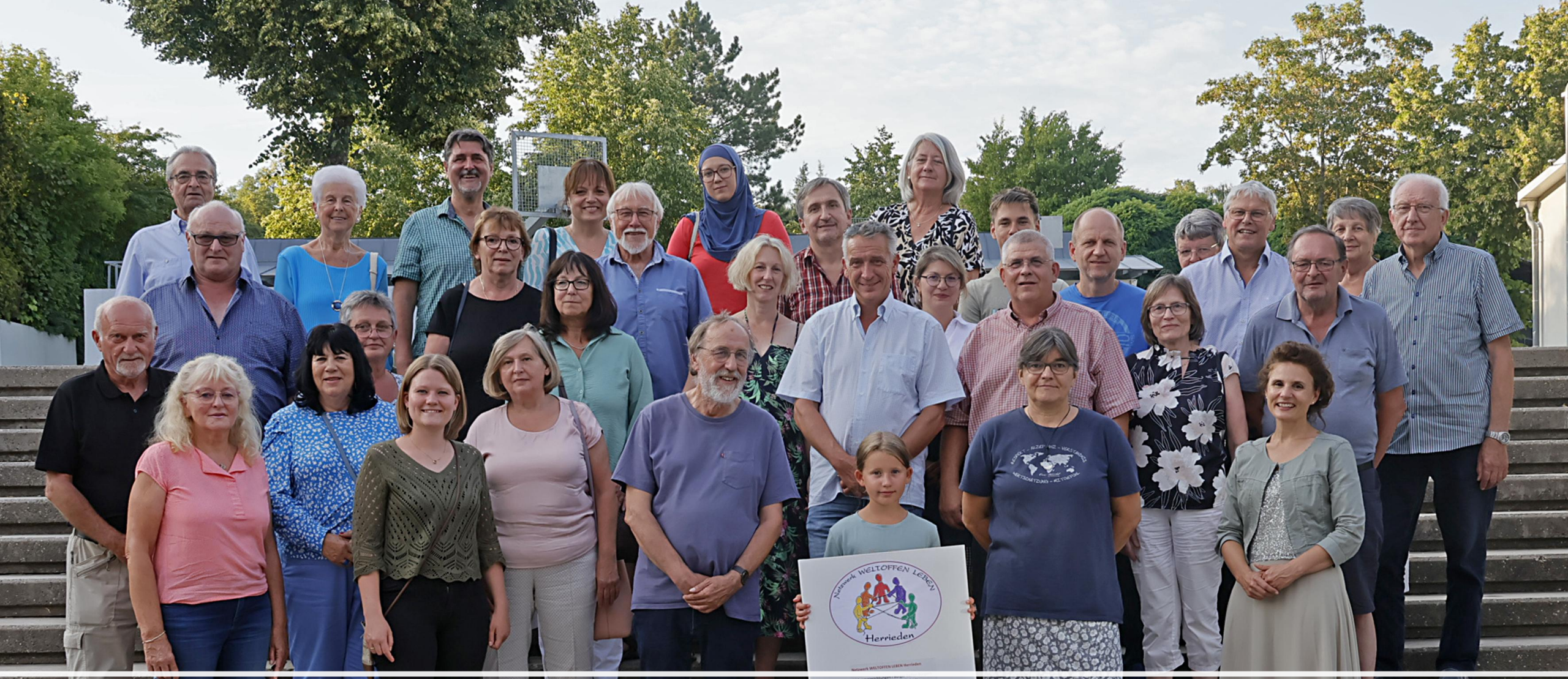
6. Koordination Netzwerk WELTOFFEN LEBEN Ehrung des Helferkreises Netzwerk WELTOFFEN LEBEN beim Sportler – und Ehrenamtsabend der Stadt Herrieden 2023