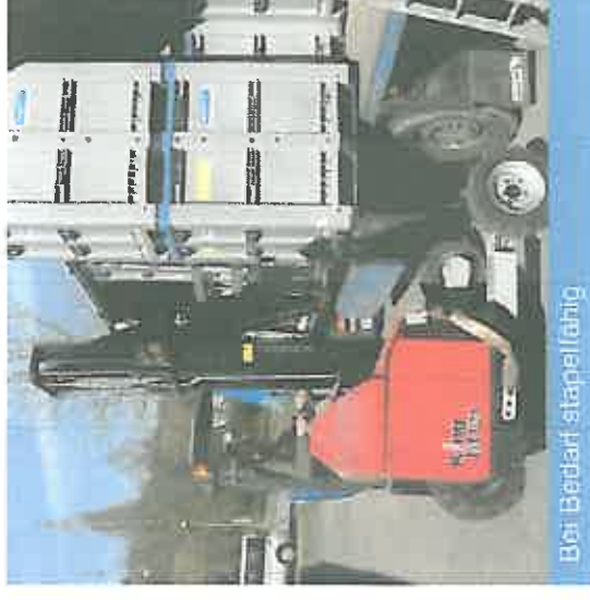
Bei Bedarf stapelfähig