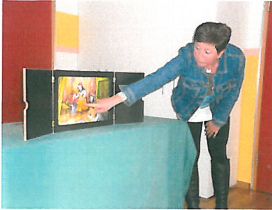
Märchenerzählung mit dem Kamishibai