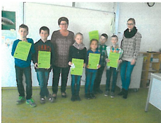
Vorlesewettbewerb der 3. Klassen