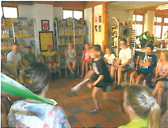
„spiel mit“ bei den Ferienspielen