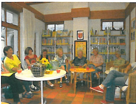
„tierisch schön“: Lesekreis im Juli