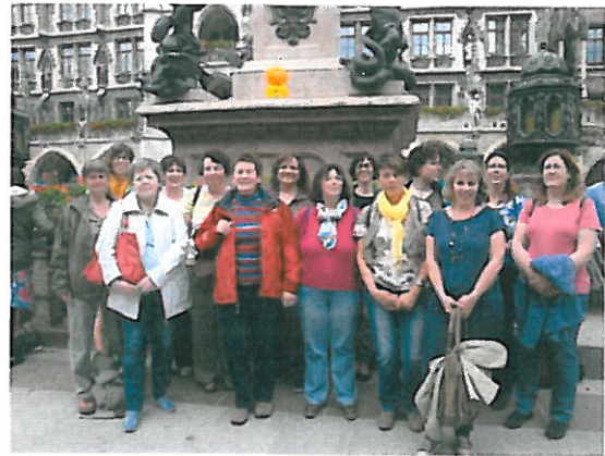
Betriebsausflug nach München