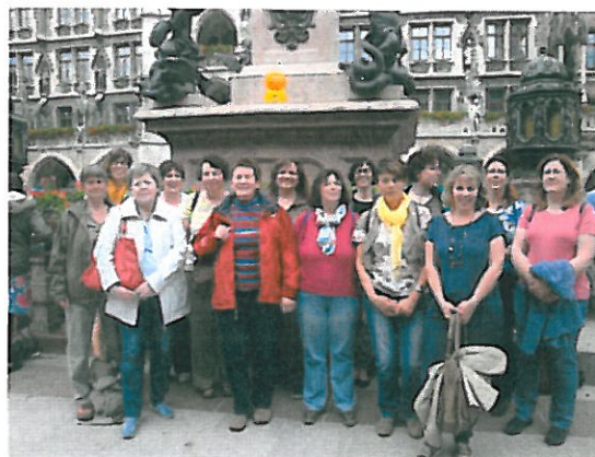
Betriebsausflug nach München