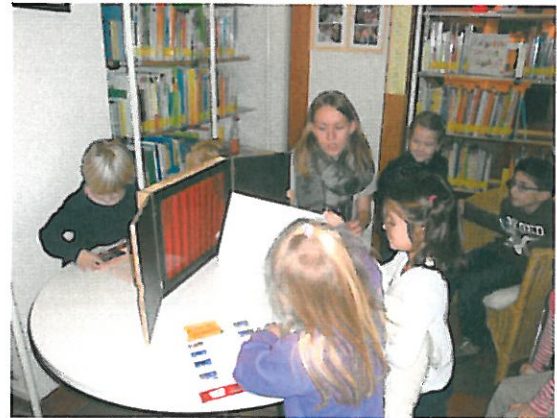
Vorlesen am Weihnachtsmarkt