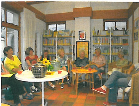
„tierisch schön“: Lesekreis im Juli