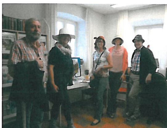
Am Tag des offenen Denkmals: wie anno dazumal in der Hutmacherei