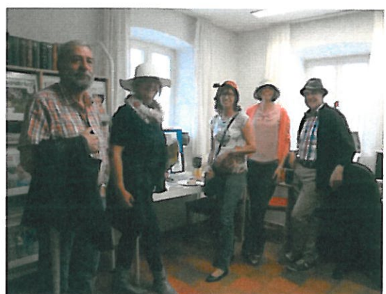
Am Tag des offenen Denkmals: wie anno dazumal in der Hutmacherei