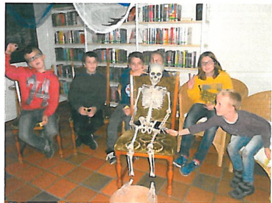
Gruselspaß und Monstermix