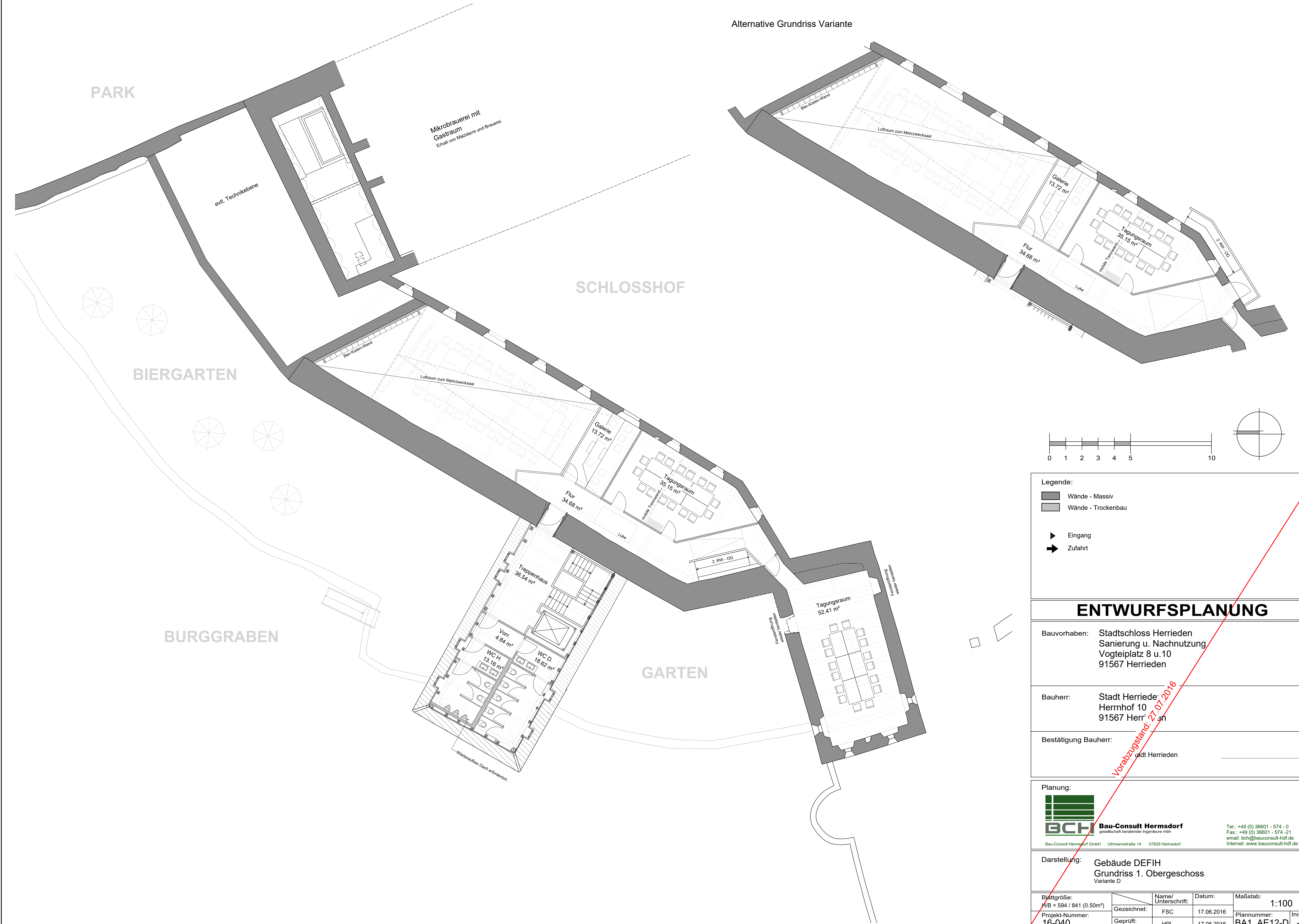
Alternative Grundriss Variante