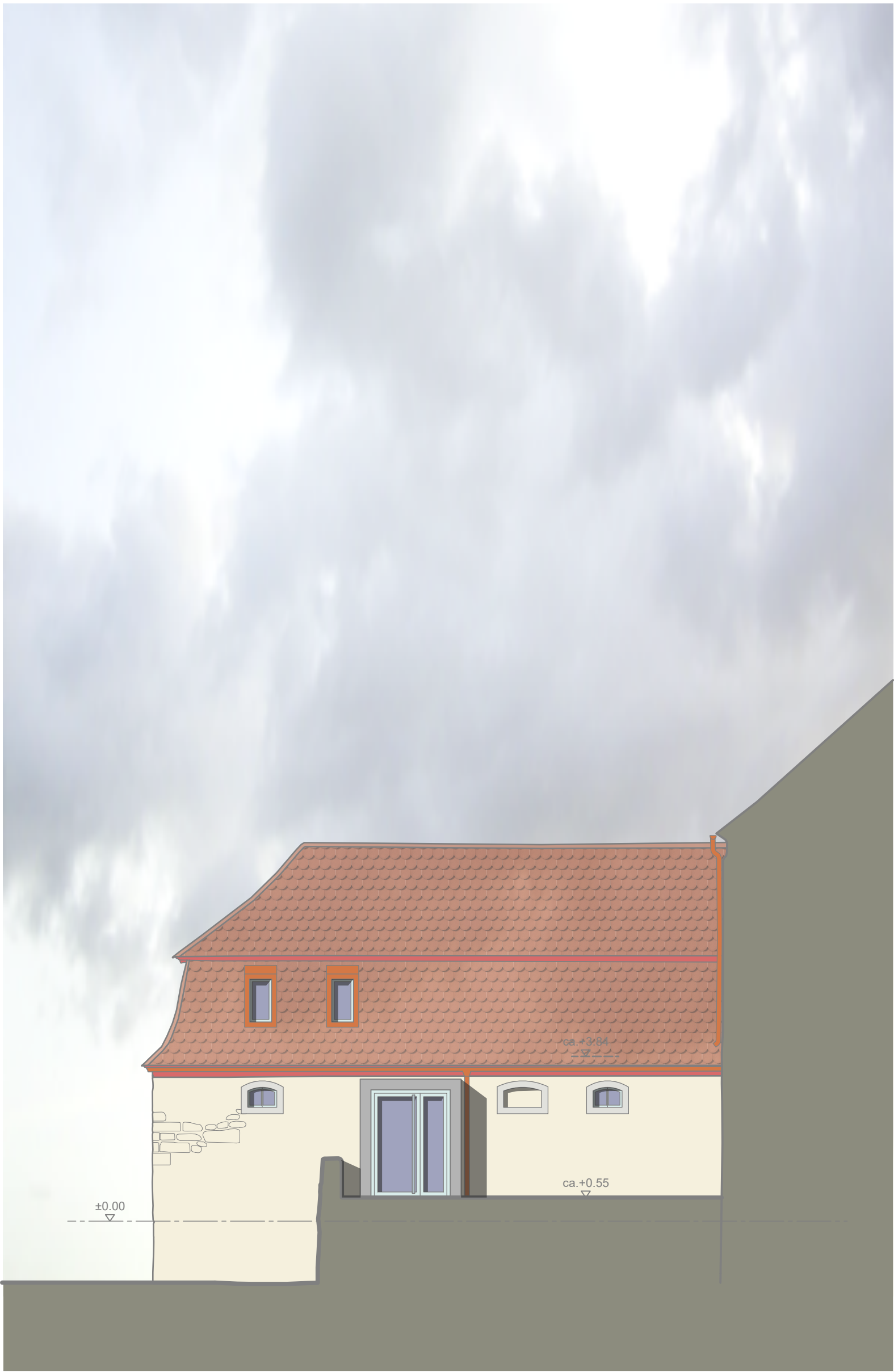
Gebäude H - Ansicht Südwest, M 1:100