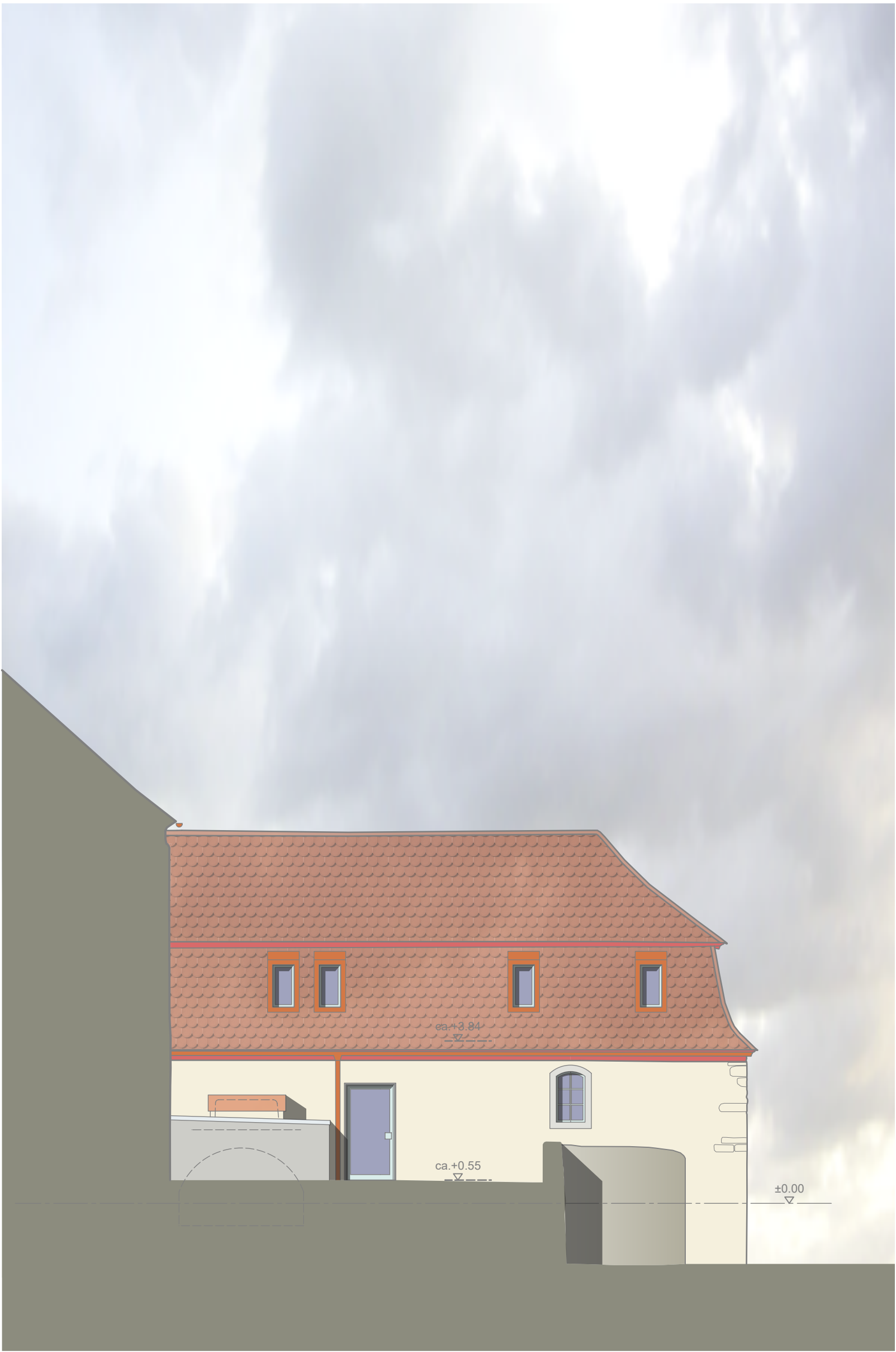
Gebäude H - Ansicht Nordost, M 1:100