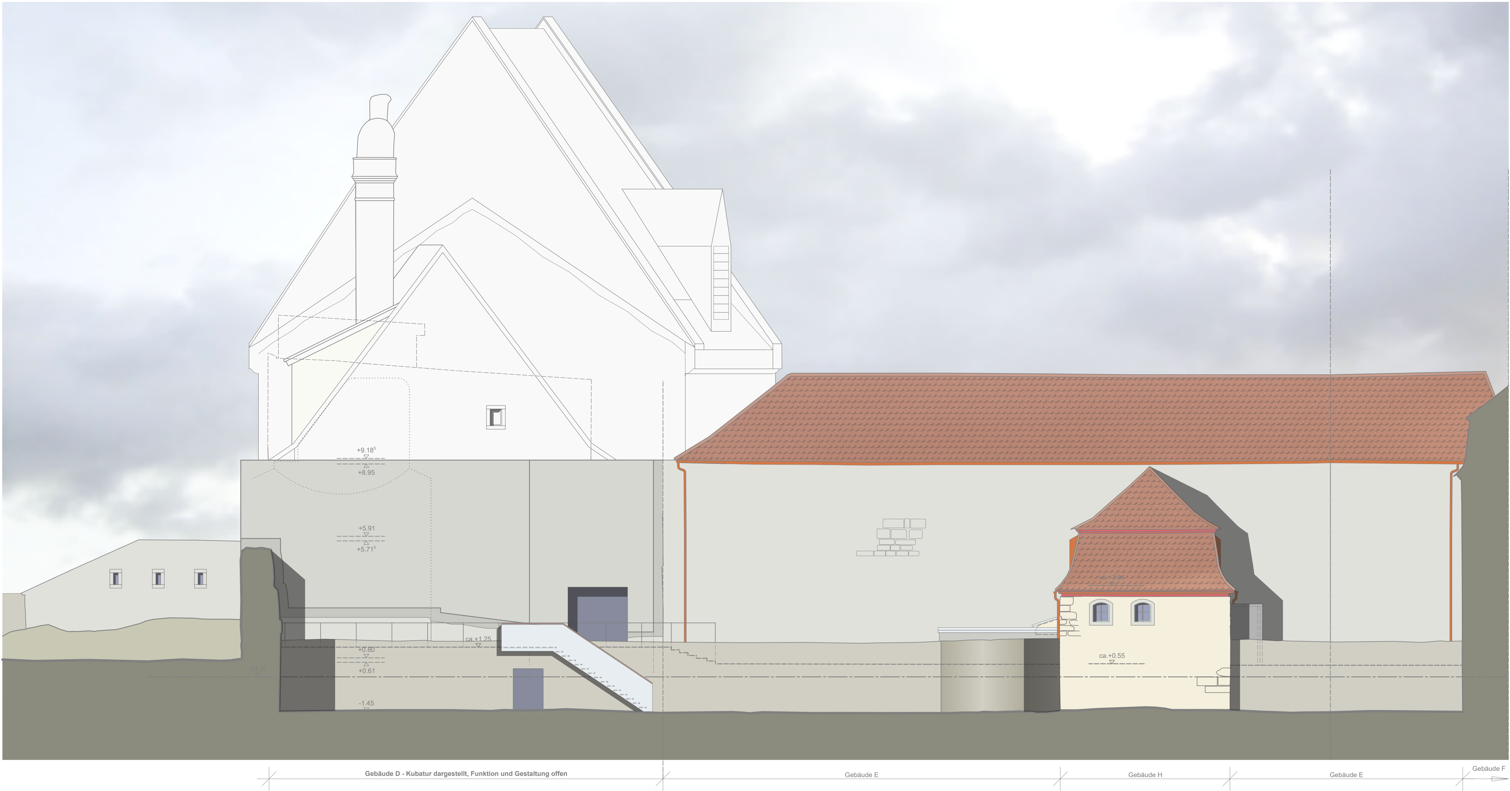
Gebäude D / E / H - Ansicht Nordwest, M 1:100