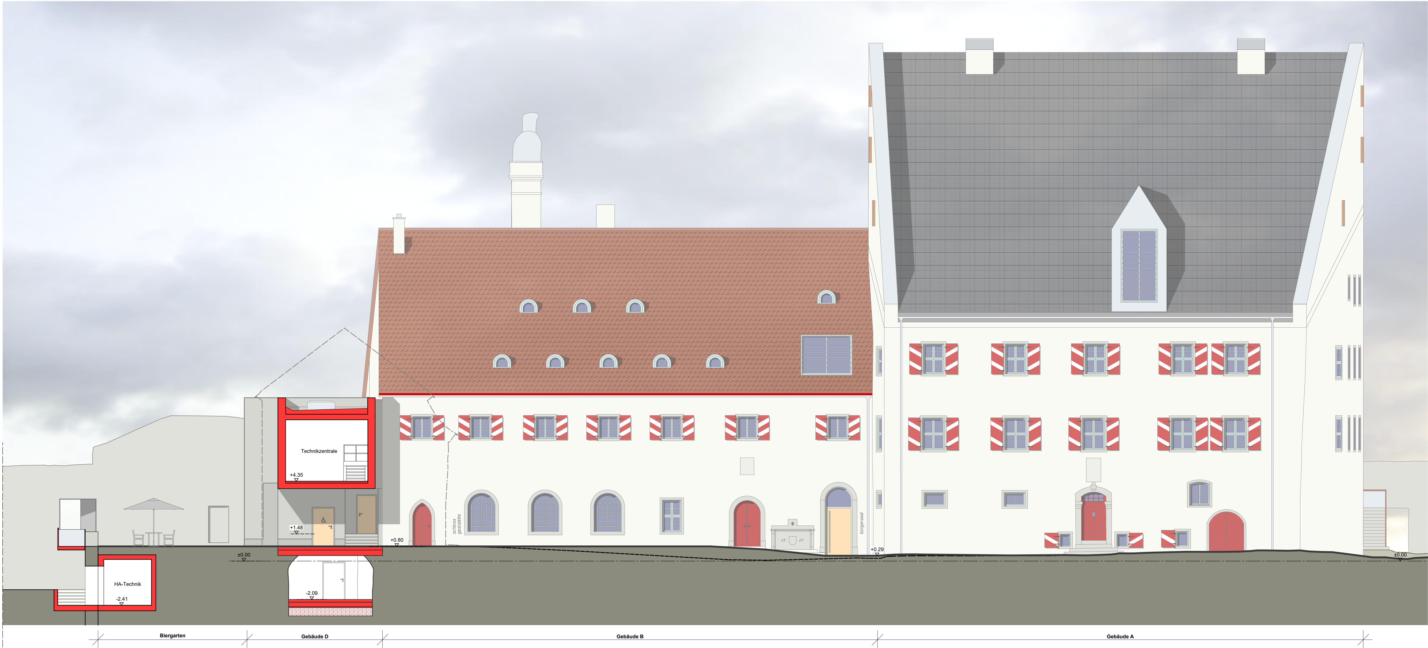
Gebäude A / B - Ansicht West, M 1:100