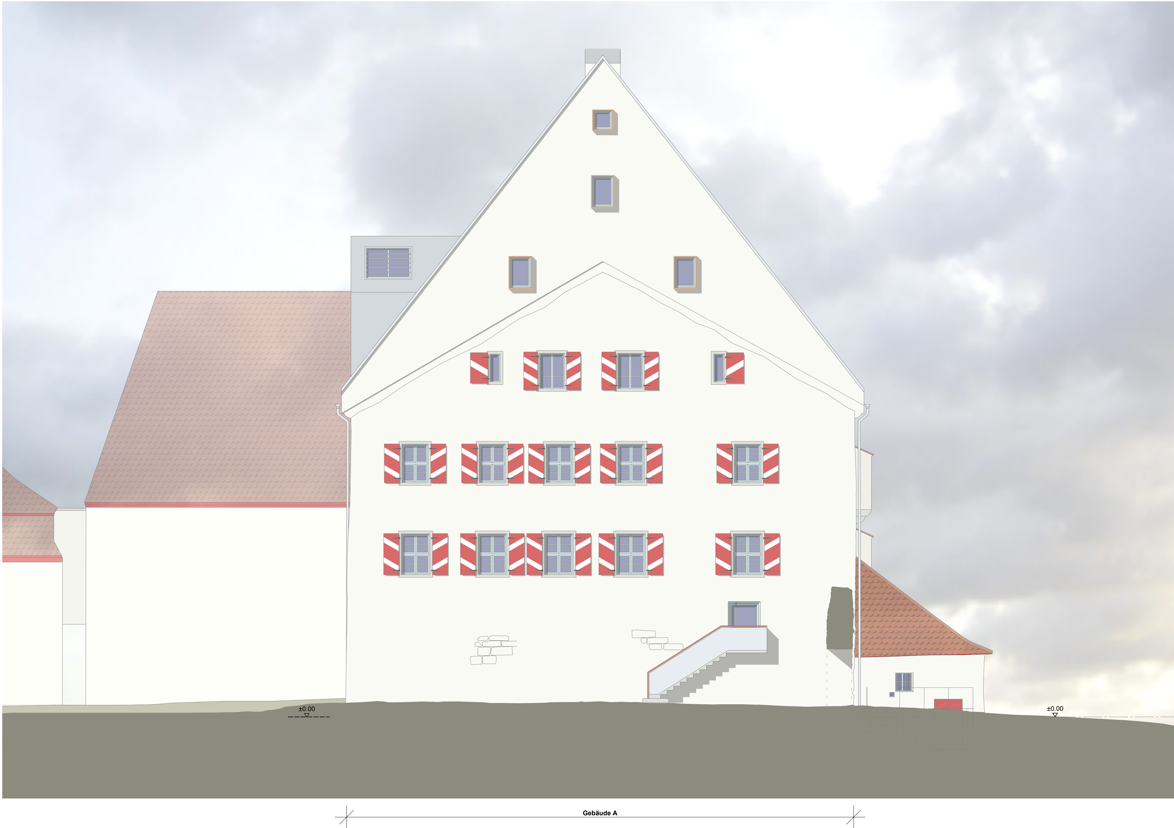
Gebäude A - Ansicht Süd, M 1:100