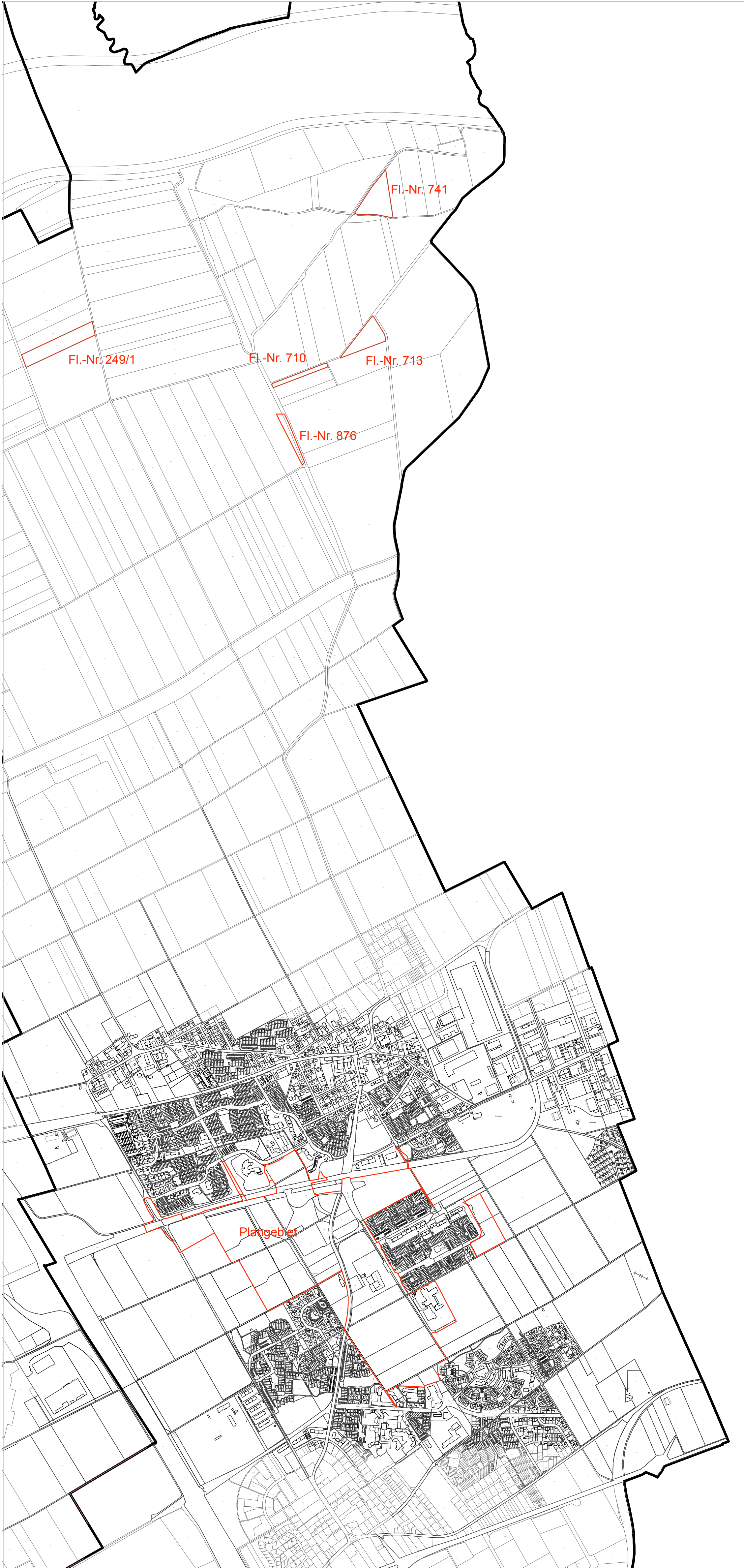
Übersichtsplan M 1:10.000

Flächen für Maßnahmen zum Schutz, zur Pflege und zur Entwicklung von Natur und Landschaft