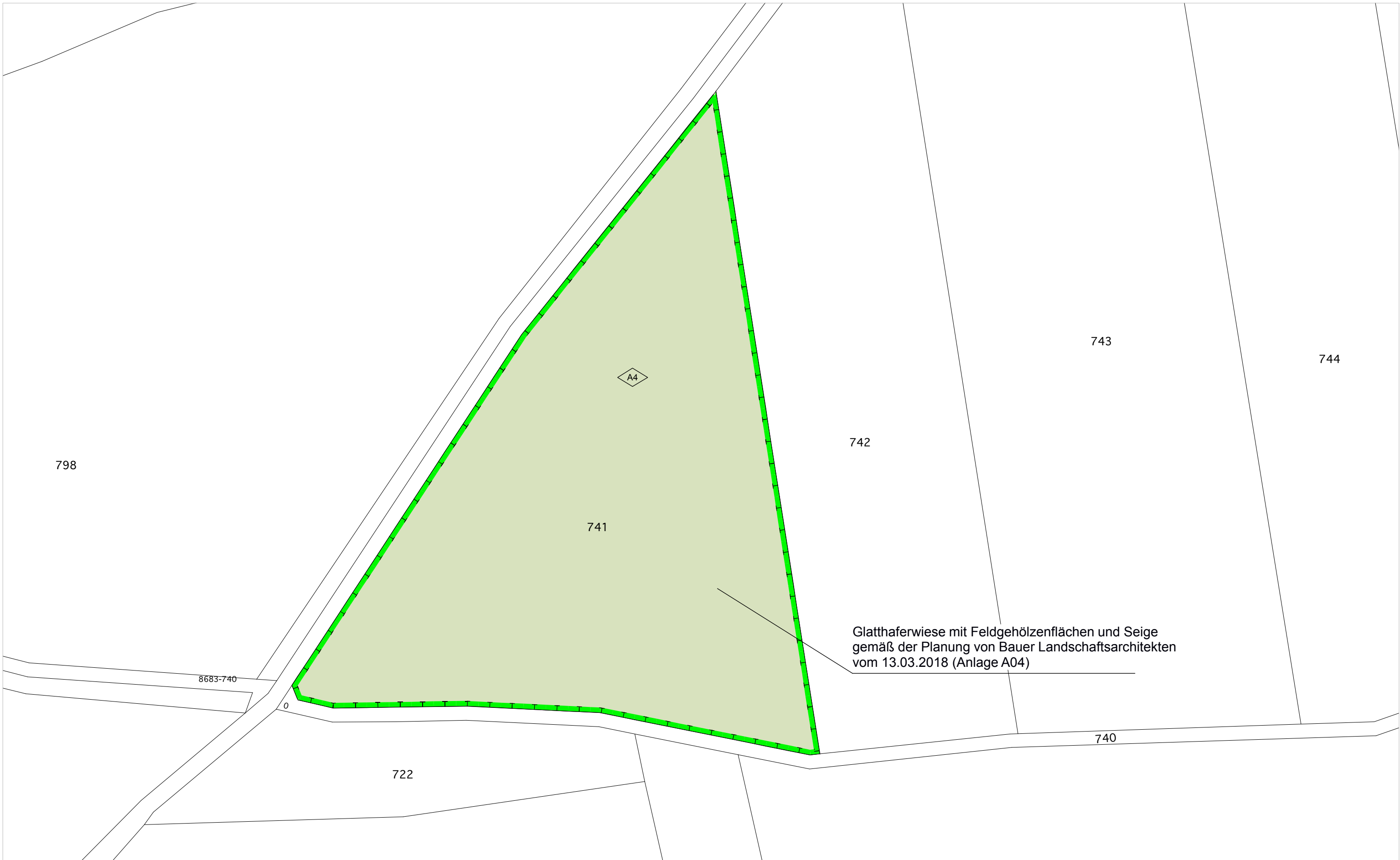
Ausgleichsfläche A4 _ Flurstücksnummer 741, M 1:1000