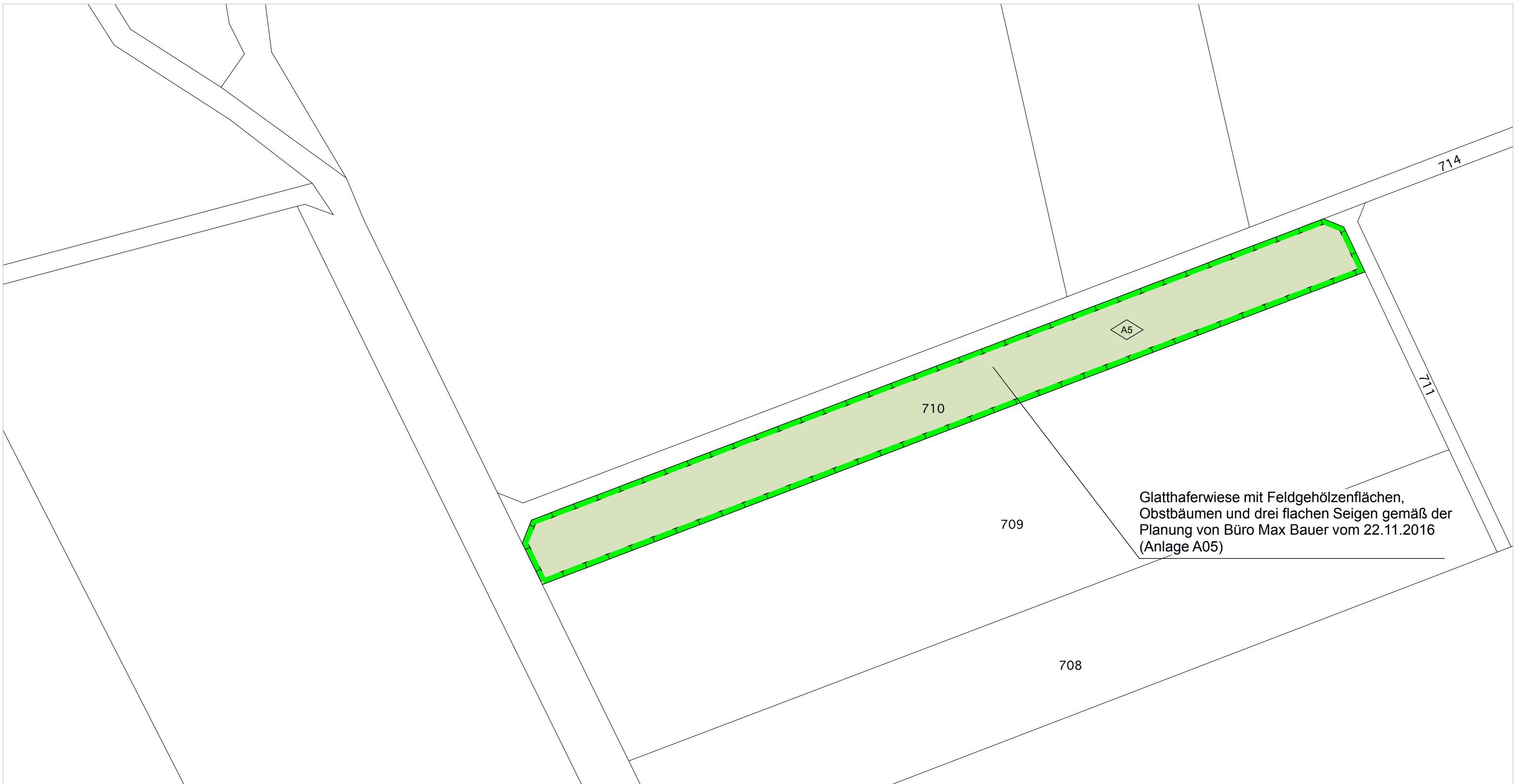
Ausgleichsfläche A5_ Flurstücksnummer 710, M 1:1000