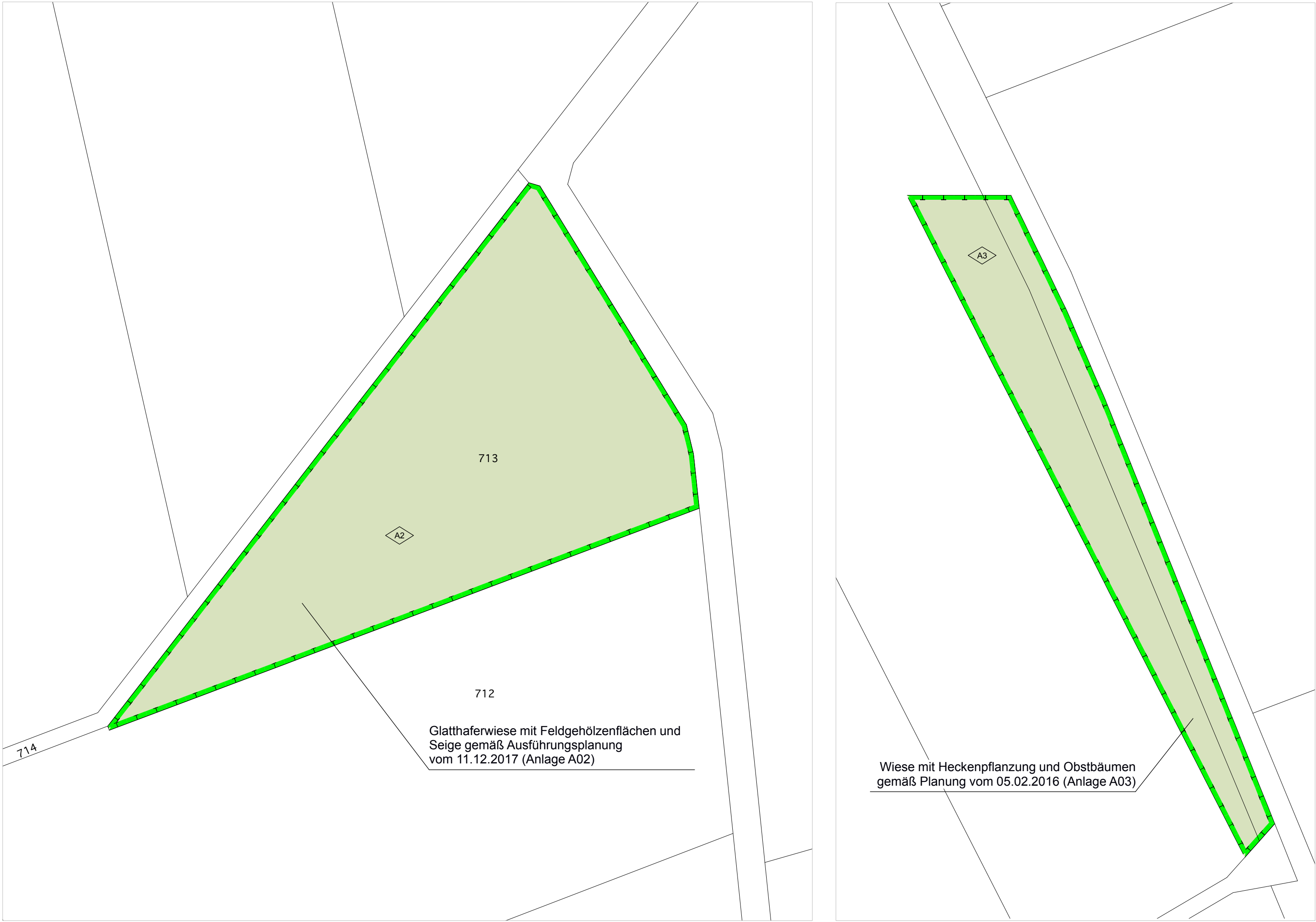
Ausgleichsfläche A2 _ Flurstücksnummer 713, M 1:1000