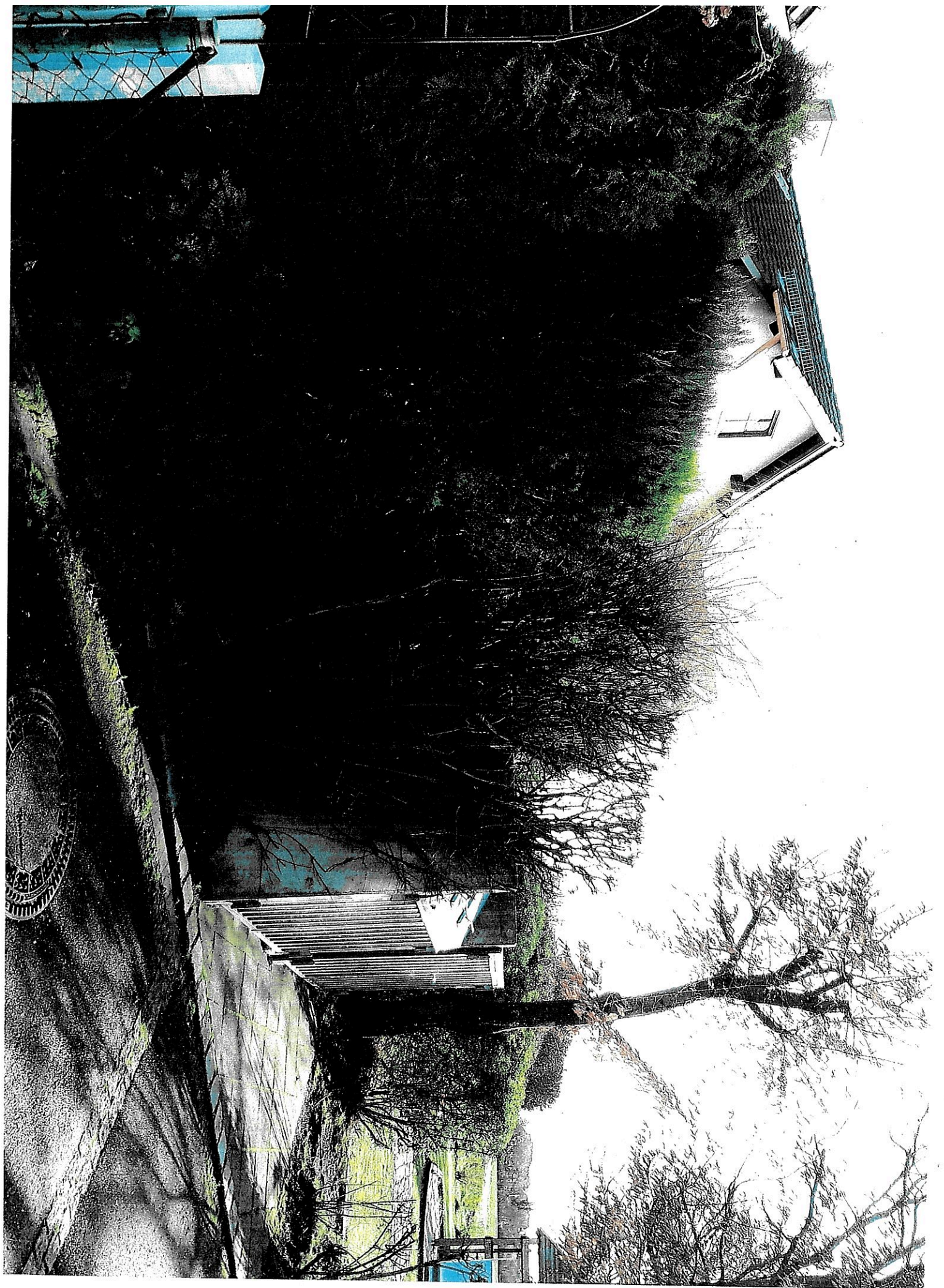
Anlage 3 Aussenblick 2