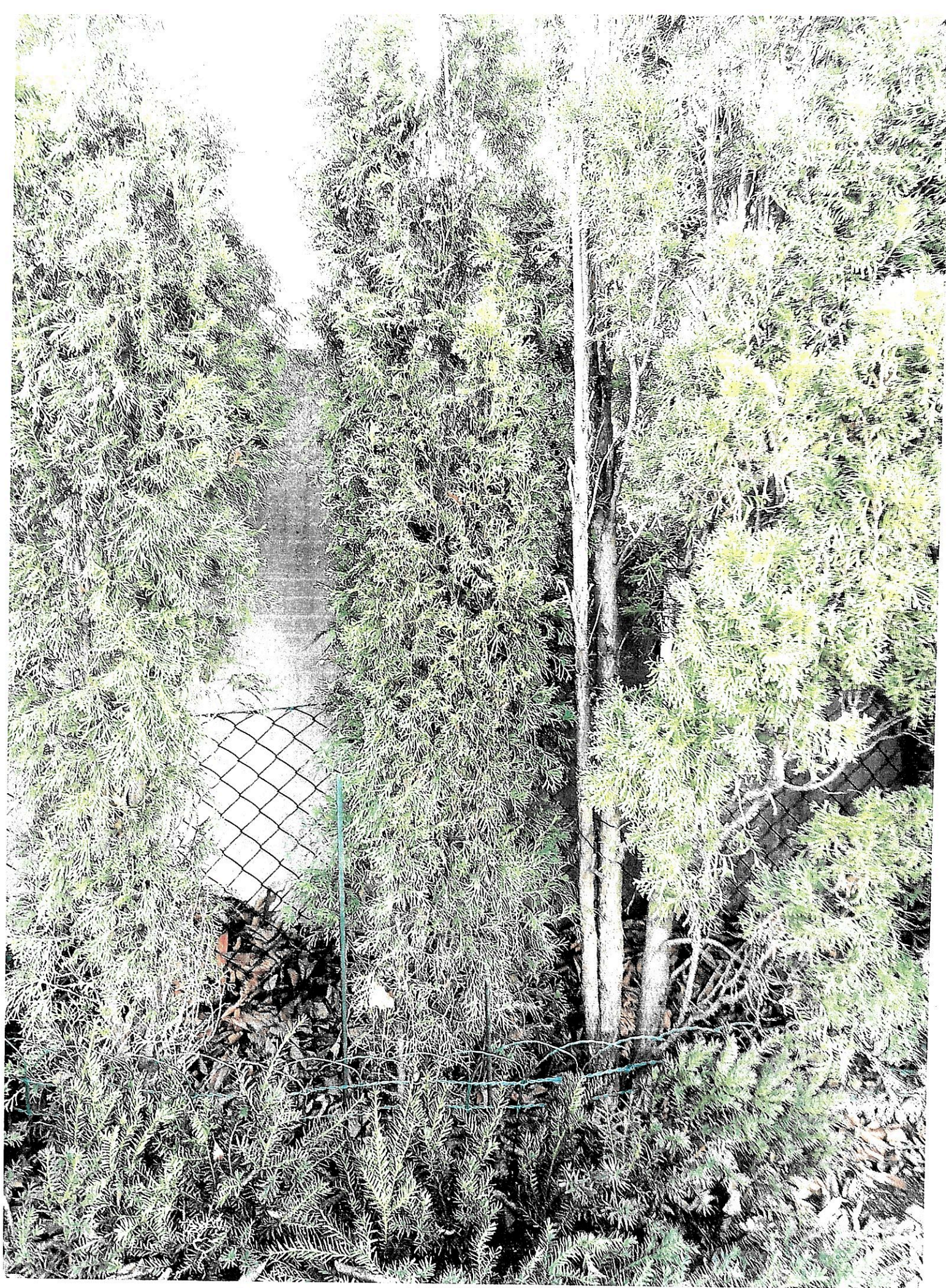
Anlage 1 Innenblick