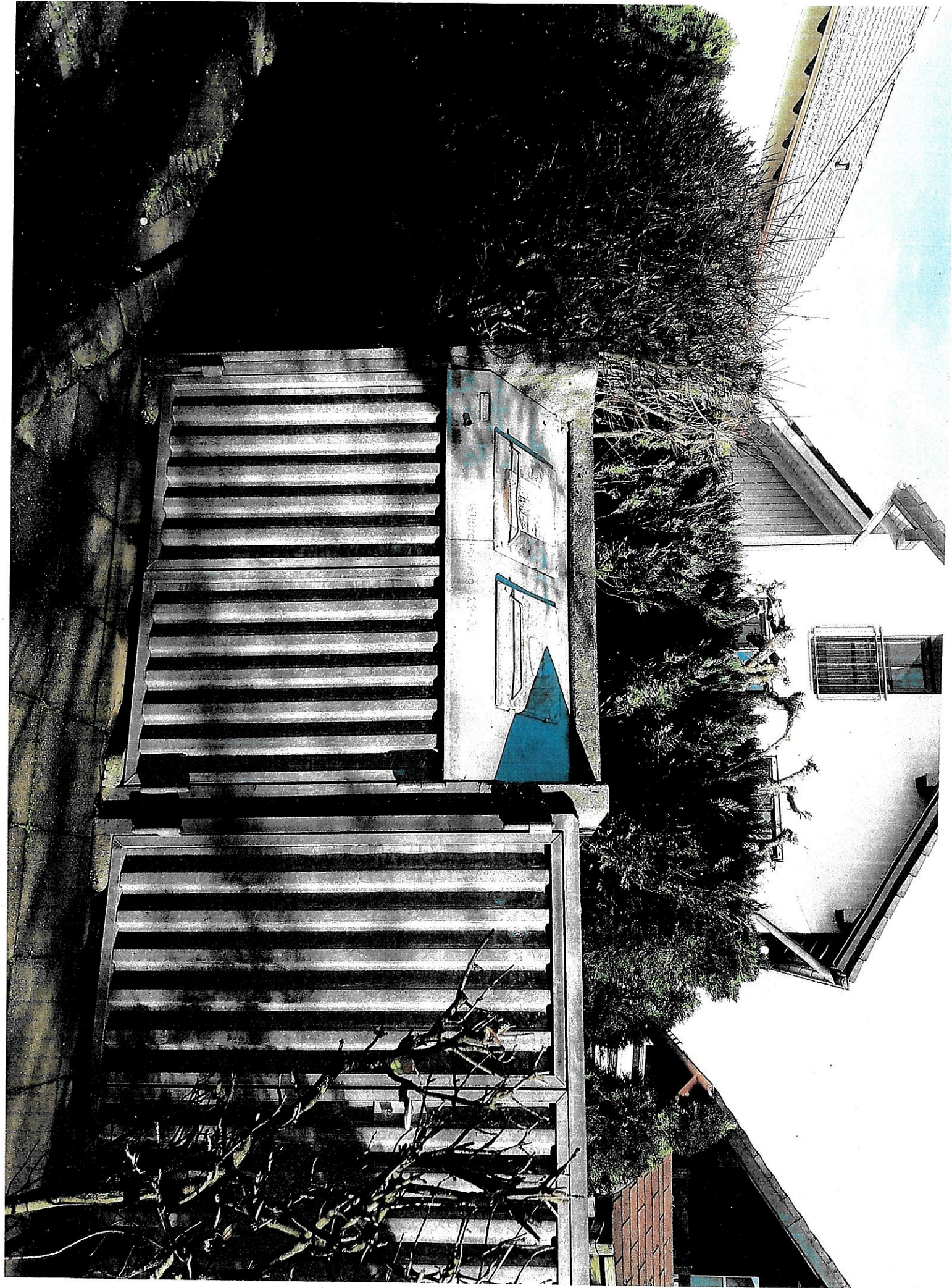
Anlage 2 Aussenblick 1