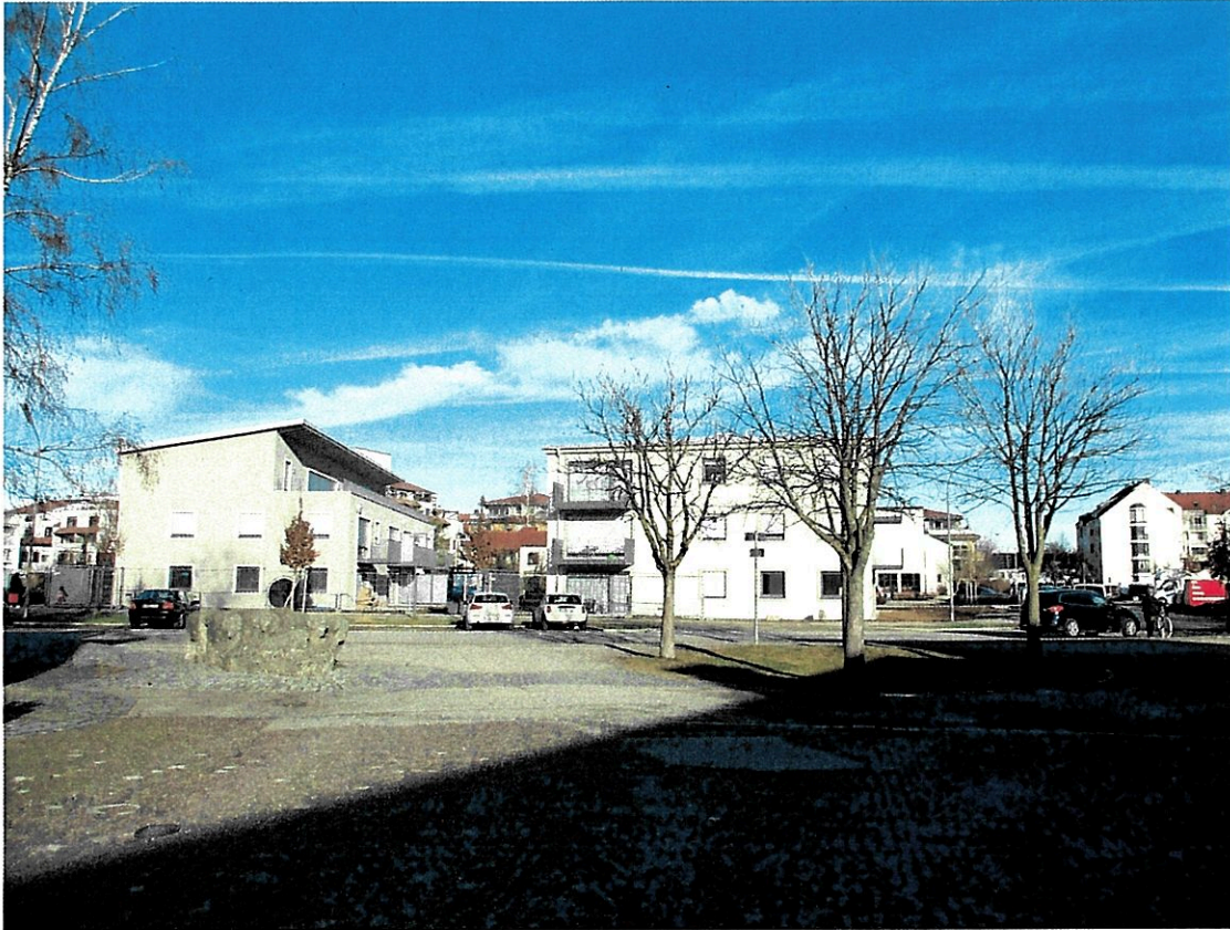
Ansicht von der Martin-Luther-Straße aus südsüdwestlicher Richtung