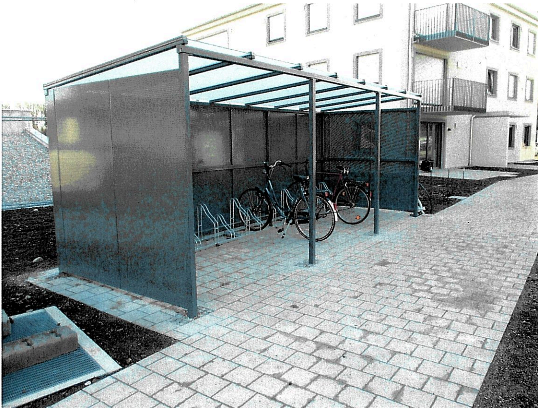
Ansicht der Fahrradeinhausung (2) Martin-Luther-Straße 71 aus östlicher Richtung