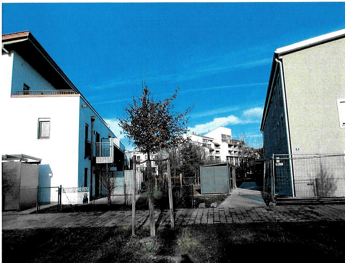
Ansicht der Müll- und Fahrradeinhausung (3) Martin-Luther-Straße 73 aus westlicher Richtung