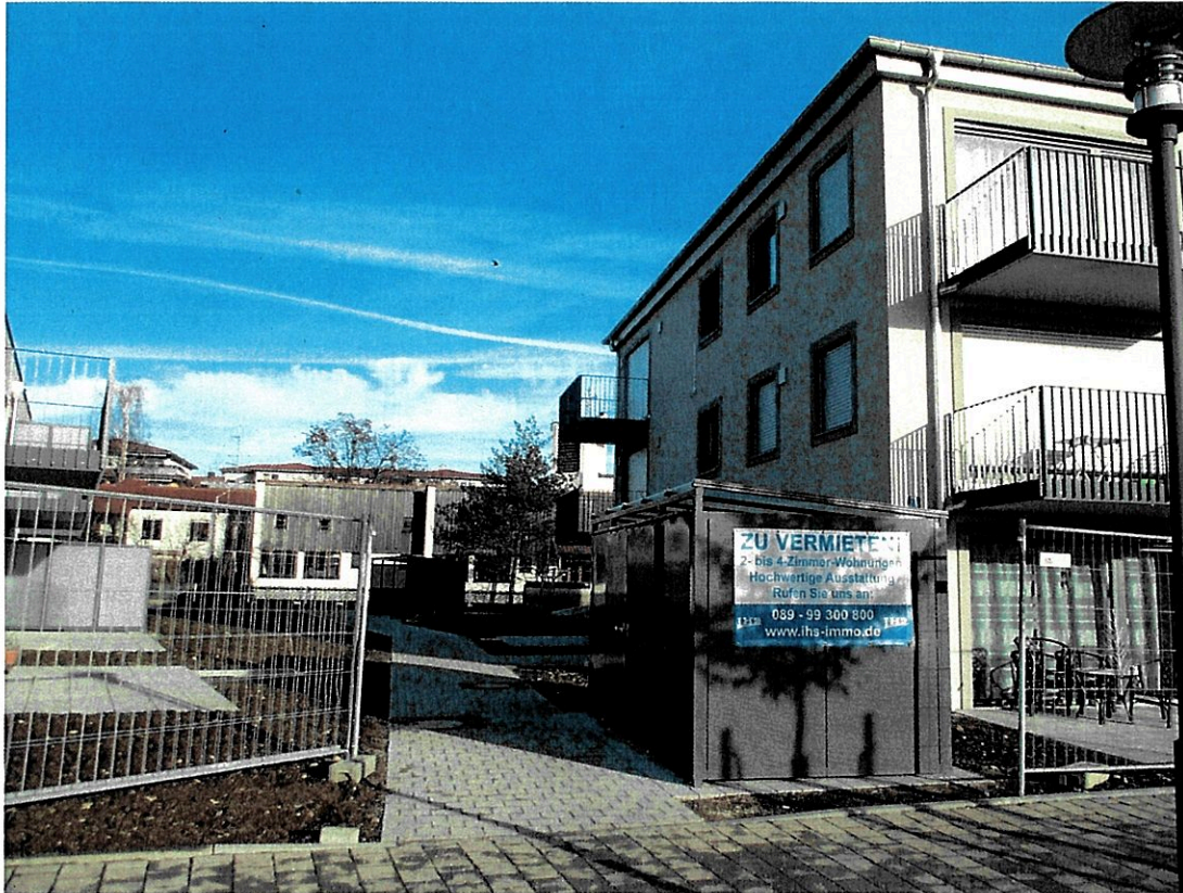
Ansicht der Mülleinhausung (1) Martin-Luther-Straße 71 aus westlicher Richtung