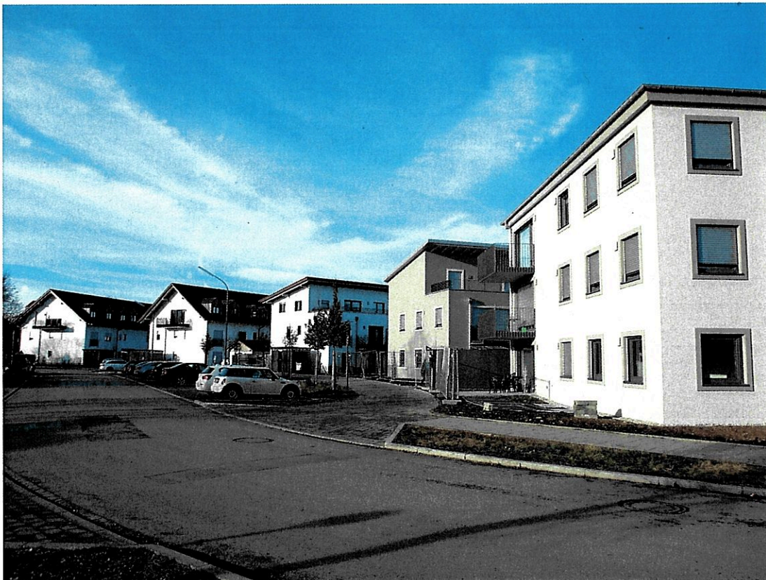
Ansicht von der Martin-Luther-Straße aus südlicher Richtung