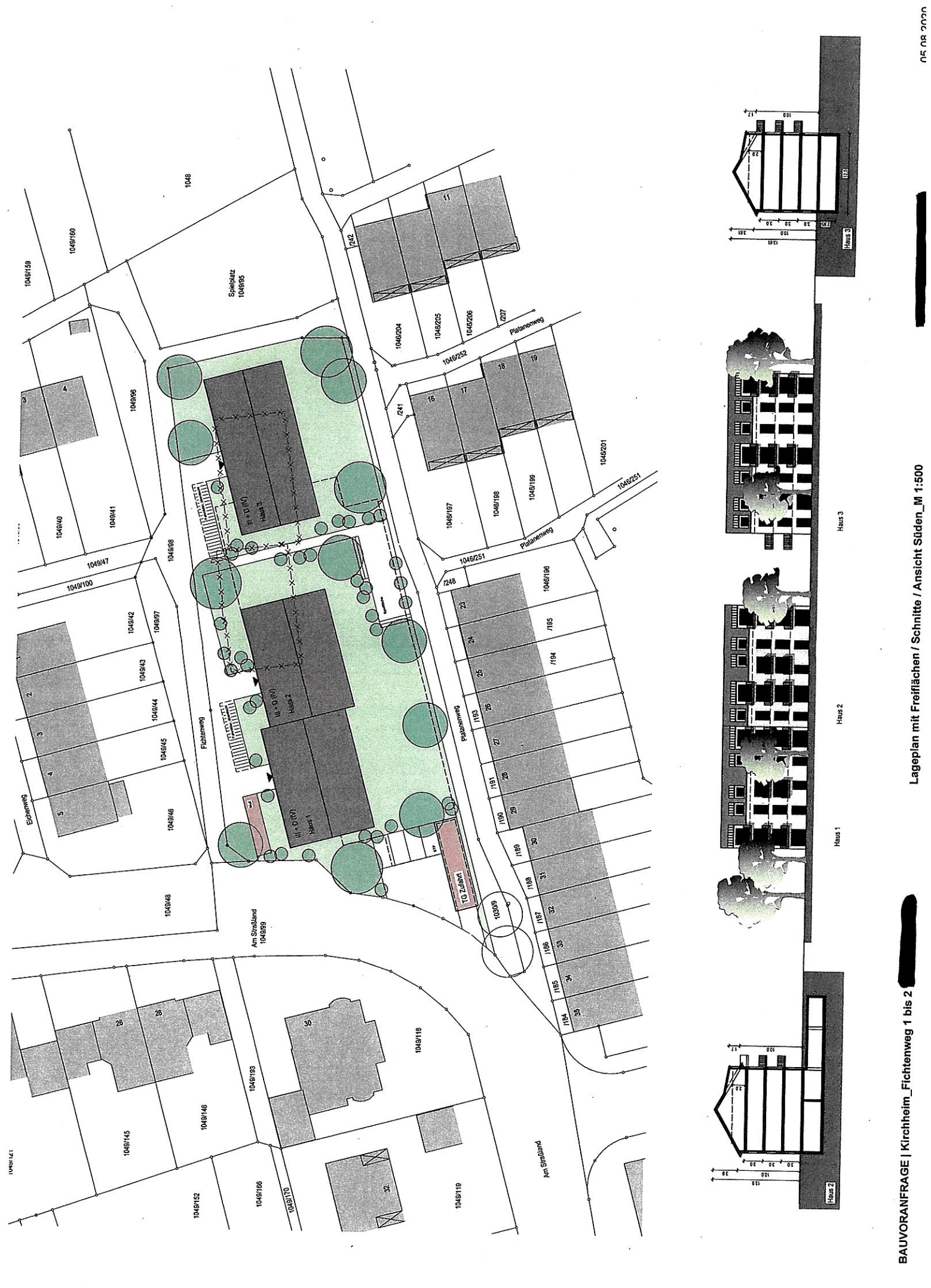
BAUVORANFRAGE | Kirchheim_Fichtenweg 1 bis 2 Lageplan mit Freiflächen / Schnitte / Ansicht Süden_M 1:500