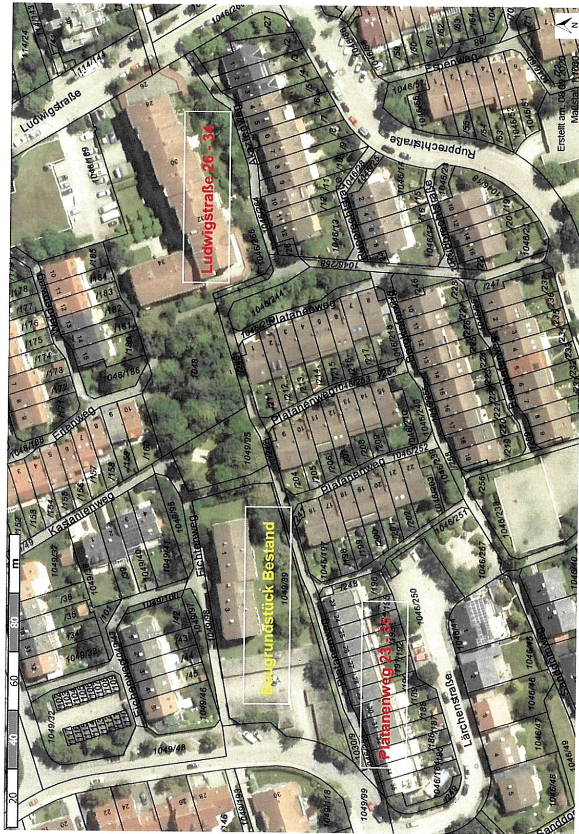
Flurkartenausschnitt mit Luftbild

Neubau von 2 Wohngebäuden / ca. 30 Wohneinheiten und Tiefgarage / 44 Stellplätze im Fichtenweg 1 - 3