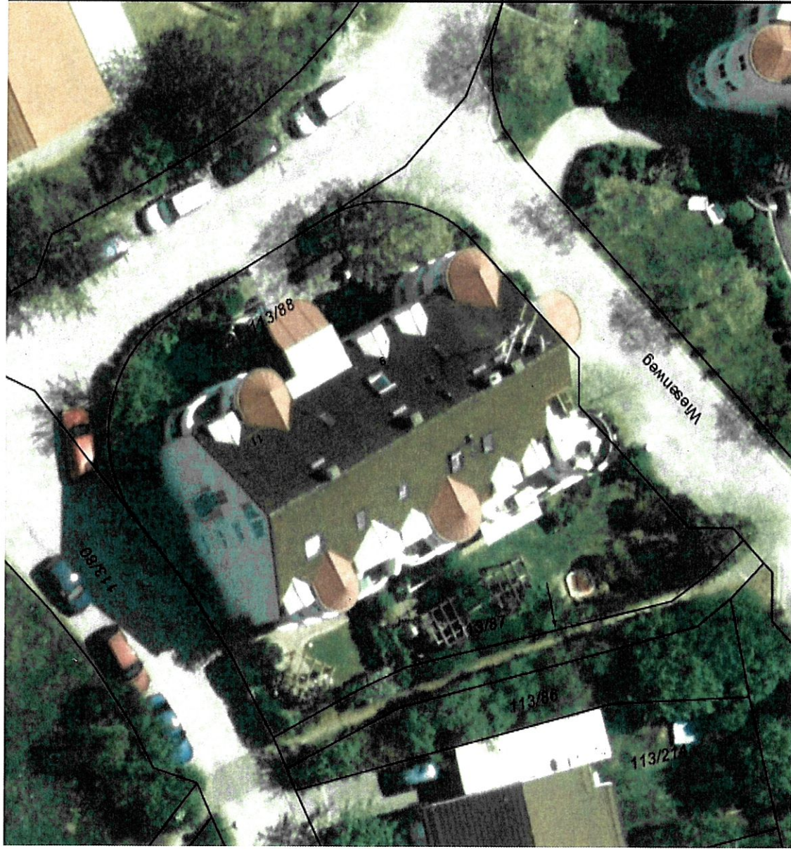
Flurkartenausschnitt mit Luftbild