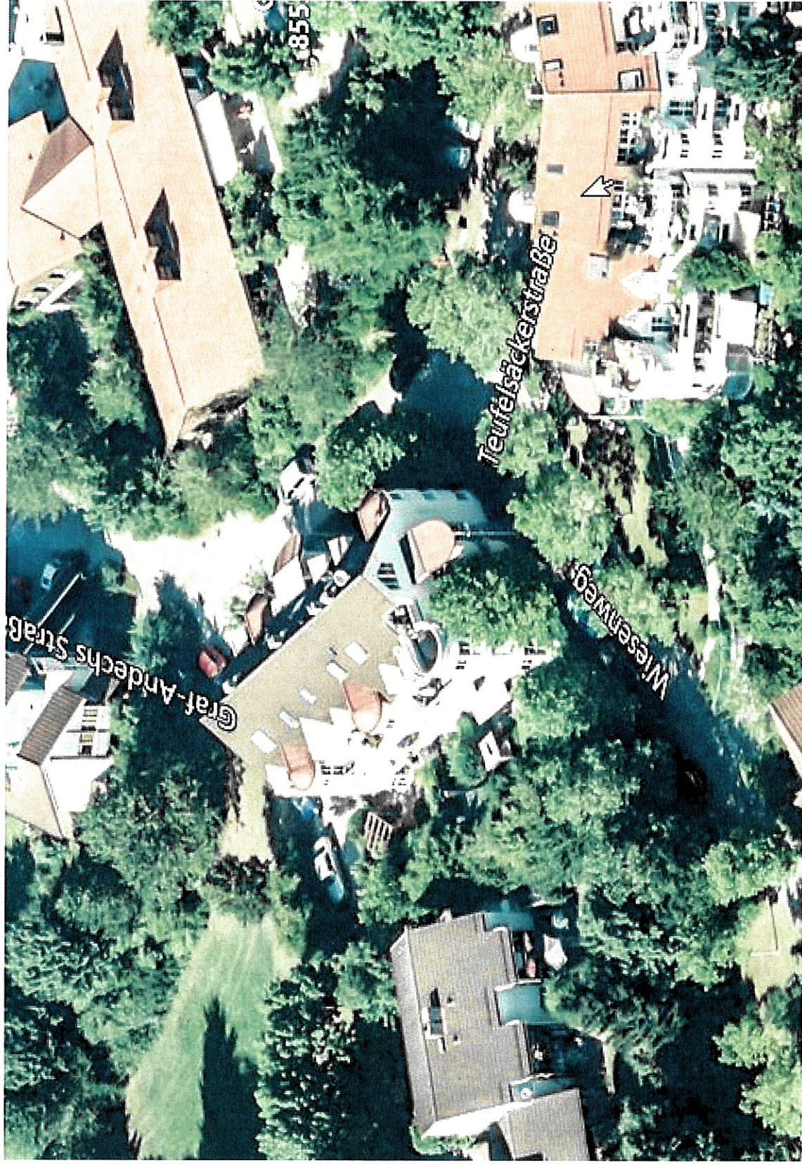
Luftbildisometrie aus südlicher Richtung