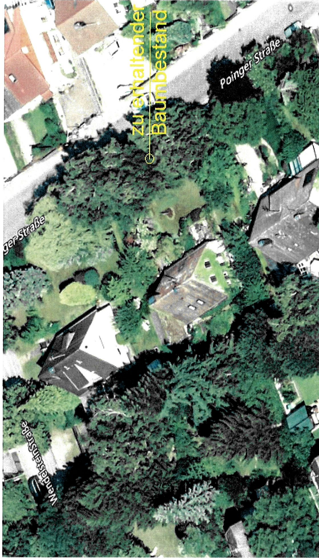
Luftbildisometrie aus westlicher Richtung